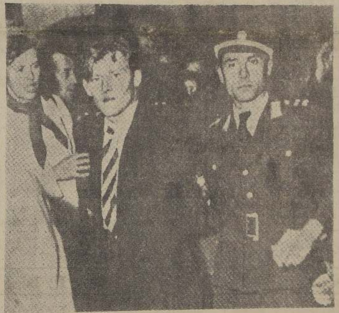
Policías alemanes del sector occidental sujetan a un muchacho atacado por la muchedumbre en la Plaza Potsdammer durante los incidentes provocados por los rusos en Berlín.

DURANTE LOS INCIDENTES EN LA CAPITAL ALEMANA