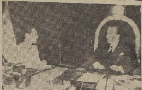
El Excmo. señor González Videla, durante la entrevista con Elsie Lessa, redactora de "O Globo", de Río de Janeiro.

O presidente Videla descreve a O GLOBO como conseguiu evitir que seu país fosse transformado pela Russia em «cabeça de ponte» contra os EE.UU. — Retirado aos traidores soviéticos o poder eleitoral, o poder municipal e o poder sindical — Origens e objetivos da Lei de Defesa da Democracia — «Só a decisão, a energia e o emprego da força contra a força poderão fazer com que as nações ocidentais detenhám a política agressiva de Moscou» — Os grandes planos de um governo progressista, tendo por base a industrialização nacional — Recordações do Brasil