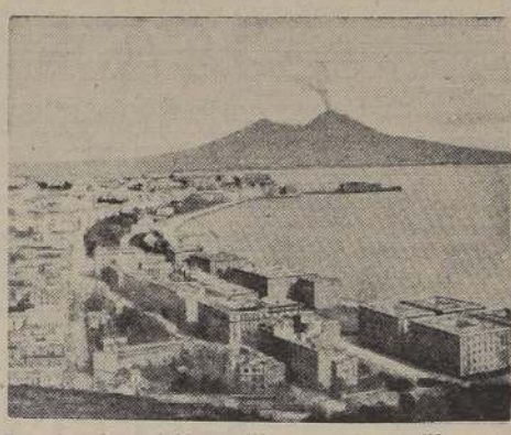
Una vista de la bahía de Napolis, puerto sometido a un violento ataque de la aviación norteamericana con base en África del Norte.

Una transmisión de la radio-emisora de Berlín escuchada por la United Press en Nueva York decía que ha habido una violenta lucha en la región de la frontera tunecina, como resultado de las mayores operaciones británicas de reconocimiento y afirmación de la frontera. Los británicos sufrieron apreciables pérdidas.