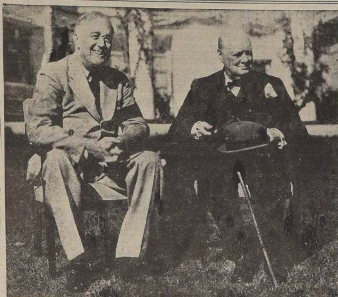
Interesante fotografía captada durante la reciente conferencia de Casablanca. Roosevelt y Churchill, sonriendo satisfechos del resultado de las conversaciones llevadas a cabo y en las cuales participaron los más altos jefes militares de ambos países y los generales De Gaulle y Giraud.

La eliminación de Korocha como punto de resistencia, es una evidencia más de la táctica soviética de reducir uno por uno los puntos de abastecimientos. Su ocupación se debió