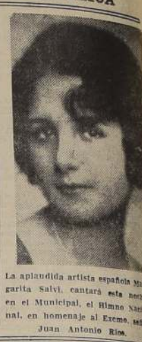
La aplaudida artista española Margarita Salvi, cantará esta noche, en el Municipal, el Himno Nacional, en homenaje al Excmo. señor Ríos.

Se pondrá en escena la comedia festiva de Carlos Carli, titulada: "Qué vergüenza para la familia", obra que ha constituido un éxito de la actual temporada. Alejandro Flores, en breves palabras, ofrecerá el homenaje de hoy al Excmo. señor Ríos.