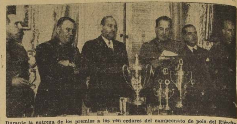
Durante la entrega de los premios a los vencedores del campeonato de polo del Ejército.