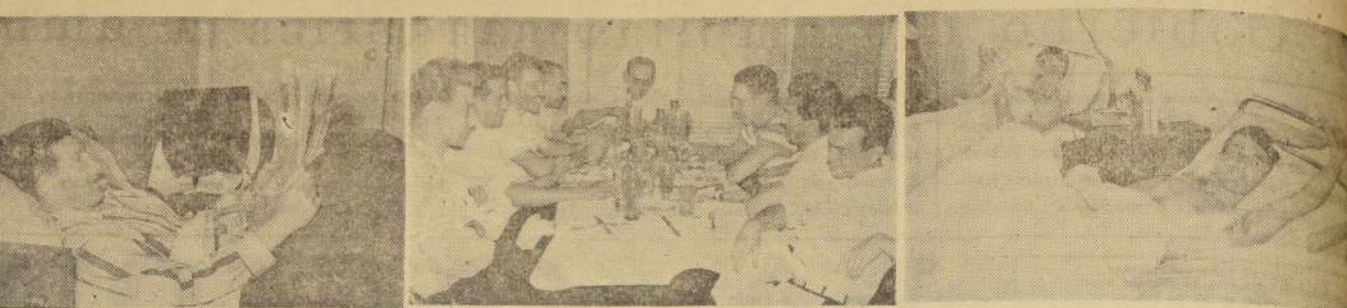
EJEMPLO DE CONCENTRACION. — La Escuela Militar, de Las Condes, es el lugar ideal para la concentración de los jugadores chilenos de básquetbol. Gozan allí de toda clase de comodidades y de un panorama excepcional, grato, hermoso. Y muy quieto. Los muchachos llevan una vida tranquila, donde predominan la amistad y la corrección entre jugadores, entrenadores y jefe de concentración. Ayer captamos estos aspectos, en una visita que nos produjo satisfactoria impresión.