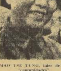
MAO TSE TUNG, líder de las "comunidades".

Sea como fuere, la "comunidad", en tanto que nueva unidad de producción agrícola, permitirá una mejor utilización del material agrícola y un mayor rendimiento de la mano de obra. La obligación de alimentar una población que crece a un ritmo vertiginoso es evidentemente la preocupación número 1 de los dirigentes chinos, y la decena de millones de trabajadores agrupados en cada "comunidad" forman una masa de manobra que puede ser afectada indistintamente a los tra-