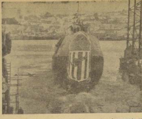
VALLEJO (California).— Este grabado muestra el momento en que se botó al agua el submarino norteamericano "Halibut", el 8 de enero. Este es el primer submarino atómico capaz de disparar proyectiles teleguidados. El "Halibut" ha sido descrito como "el arma más poderosa individual, como submarino, en el mundo".