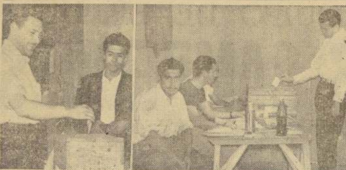
CUMPLIENDO con su deber cívico en la jornada electoral de ayer, haciendo un pequeño alto en el diario "training", los componentes de la selección nacional de básquetbol. Debidamente autorizados se despidieron por todos los ángulos de la capital y votaron. Aquí vemos a dos conspicuos integrantes de nuestro plantel al