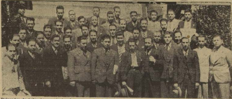
Delegados de todas las provincias del sur y norte del país participantes en el Decimo Congreso de la Federación Santiago Watt, que ayer nos expresaron su reconocimiento más explícito para la obra informativa de "LA NACION" en las actividades gremiales y, en especial, frente a la asamblea nacional que celebra el esforzado y meritorio gremio de los Maquinistas, Fogoneros y Ayudantes de toda la red.