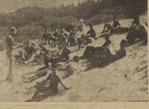
Una charla al aire libre, en la playa de La Granja.

Desde hace más de cinco años, a esta parte, se viene realizando una obra de altruismo digna de los mejores siglos. Nos referimos a la noble iniciativa de una persona profundamente conocedora de las necesidades materiales y morales de nuestro pueblo, quien ha acudido en ayuda de algunos hijos de obreros que, por las carencias de sus medios económicos, no les es posible salir fuera de Santiago en la época de verano, ni mucho menos disfrutar del clima de la costa ni de los saludables baños de mar. Sin embargo, numerosos jóvenes cuidadosamente seleccionados han podido pasar en el presente año una corta temporada en la región denominada La Granja, cerca del balneario El Tabo, o sea, en el Campamento de la Asociación Cristiana de Jóvenes.