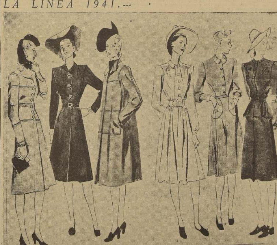
Diseños de abrigos y batas para el Otoño de 1941 que no traen las últimas revistas de New York