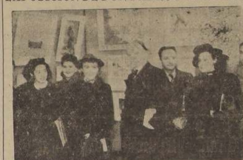
Durante la inauguración de la exposición de Pablo Burchard

Ayer, a las 18.30 horas, se inauguró, en la Sala de Arte de la Casa Eyzaguirre la exposición de las últimas obras del maestro don Pablo Burchard.