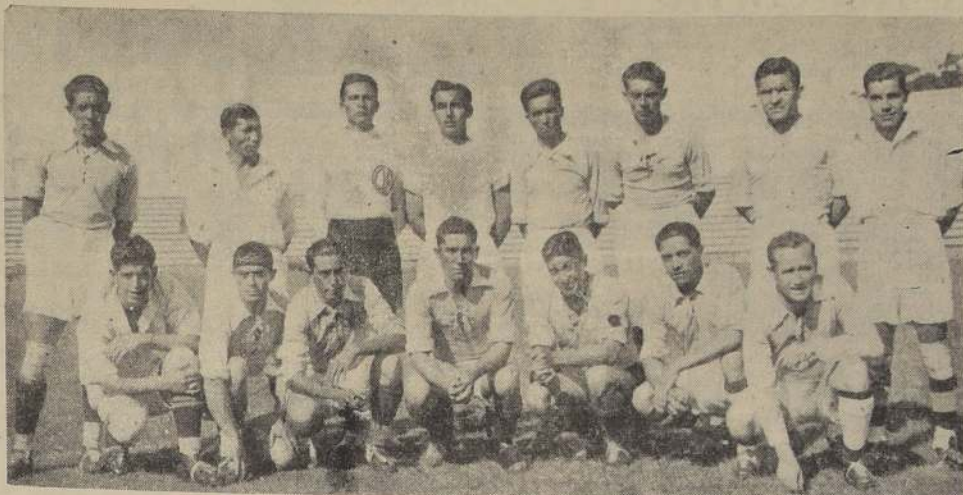
Cuadro seleccionado de Iquique que debuta hoy en Santiago disputando la final del campeonato nacional amateur

de alentar a sus co-terranos y ayudarlos en su dura tarea. Nos da este hecho una muestra elo-cuente del interés que reinaba en la región sur del país por presenciar el match final del Campeonato Nacional. Se enfrentarán estos aficionados a los muchos que ya hay en la capital y formarán así una "barra" entusiasta y capaz de llevar al cuadro a cumplir una notable performance.