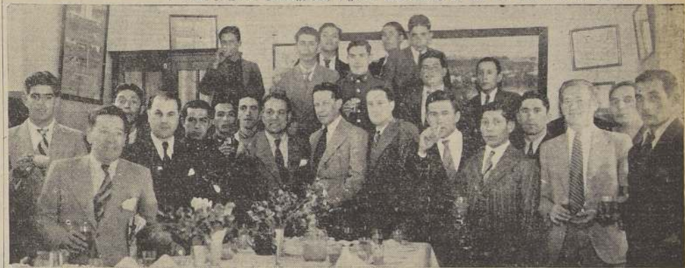
Durante la manifestación ofrecida anteaer por la Federación de Football de Chile en honor de la delegación iquiqueña, en el local de la secretaría de la dirigencia máxima.

El campeonato del Deportivo La Salle. El próximo domingo 19, el Deportivo "La Salle F. C.", llevará a efecto el gran campeonato de football, que ha venido preparando con gran entusiasmo entre las instituciones de barrio, hay gran interés por tomar parte en este torneo, los premios se exhiben en Independencia No 902, los partidos se jugarán en la cancha de O'Higgins No 2051, donde se siguen recibiendo las inscripciones.