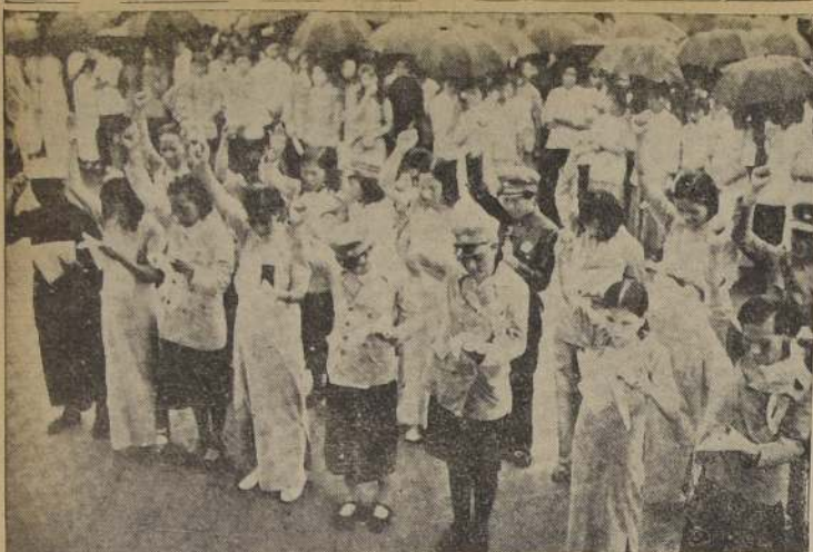
Estudiantes chinos prestan juramento de defender Nanking hasta la última gota de sangre

Argentina D. LUIS EGUIGUREN DES- EMBARCO EN B. AIRES BUENOS AIRES, 11. — (U. P.). En el vapor italiano "Con- te" llegó el doctor Luis