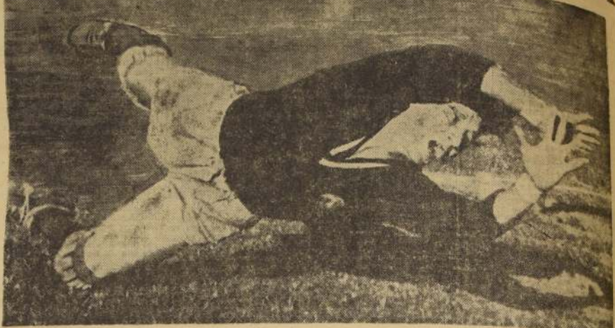
El "veterano" arquero de Audax, mantiene sus grandes condiciones. Completará con Olivos, Logán y Torres, una buena defensa.

LOS EQUIPOS de fútbol de Juventud Baquedano, Irán