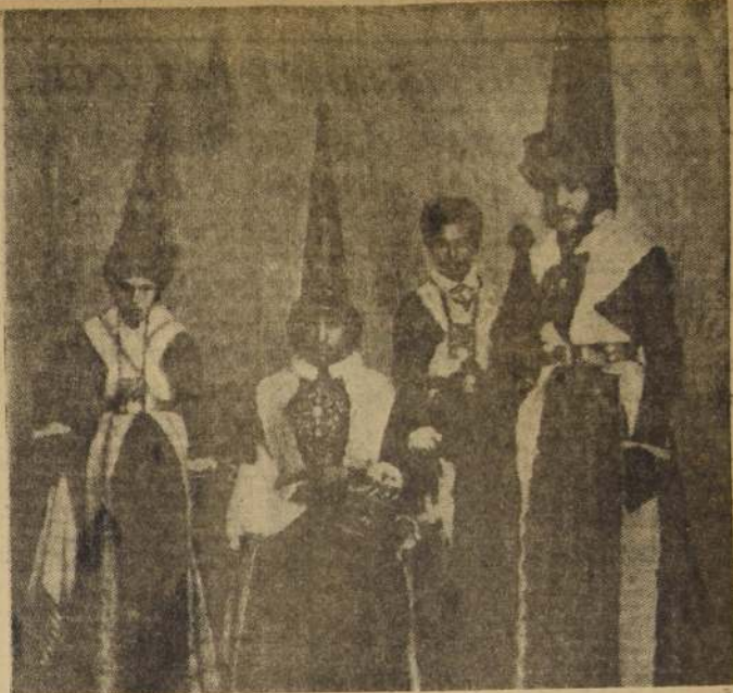
COFRADERAS EN CHILE EN 1860. — Grupo de penitentes, eucucuchos de la Hermandad del Santo Sepulcro en Semana Santa. Esta foto de M. Balnville, nos muestra, como las diversas cofradías mantenían la tradición para hacer resaltar los diversos actos de la Semana Penosa o Semana de Indulgencias, como se la llamó antiguamente.

Había cofrades para gente de color, como la de la Regoleta Franciscana; la Compañía de Nuestra Señora de Chiquinquira, para negros y mulatos, y la de Nuestra Señora de la Consolación, para españoles y criollos, en la Colonia.