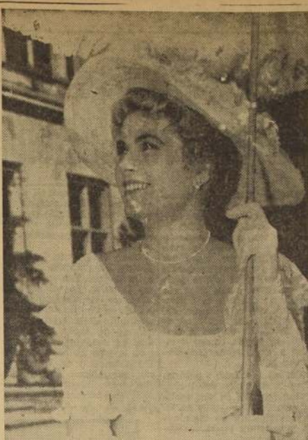
EL ENIGMA DE UNA SONRISA.

ALCAZAR. — Matinée a las 14.30 y noche a las 20.30. El único testigo.