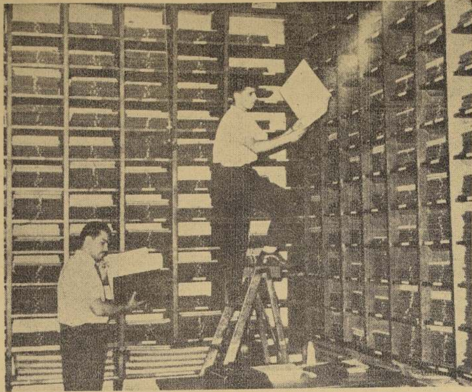
EL ARCHIVO ELECTORAL.— He aquí una vista parcial del Archivo de la Dirección del Registro Electoral. Cuando muere una persona mayor de 21 años, los oficiales del Registro Civil tienen la obligación de informar de este hecho al Registro Electoral, y lo mismo deben hacer los Jueces del Crimen, cuando alguna persona es condenada a pena aflic-