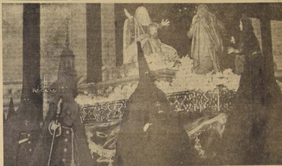
SEMANA SANTA EN ESPAÑA. — Uno de los "pasos" de Valladolid, en el que aparecen los cofrades con sus largos capuchones y cirios. Los imagineros españoles han dejado a través de los

tiempos las mas acabadas obras de arte, que fiel a la tradición, recorren las calles de las ciudades españolas en la Semana Santa.