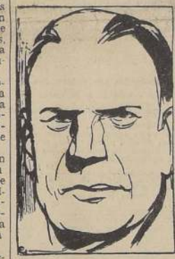
MAURICE THOREZ, jefe del Partido Comunista francés

La carrera política del general De Gaulle terminó, en forma supuestamente "irrevocable" cuando, acompañado de su esposa, partió en automóvil desde su residencia en el barrio parisense de Neuilly con destino oficialmente "desconocido". Sin embargo, se supo que De Gaulle se dirigía a la casa de campo que posee cerca del Bosque de Marly, no lejos de París, de donde se trasladará más tarde a la casa que posee en la zona de la Senna.