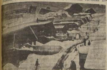
Parte de Sewell después de una nevazón

Es probable que hoy se dirija al mineral una brigada de primeros auxilios de la Dirección General de Auxilio Social, con toda clase de elementos para atender a los damnificados.