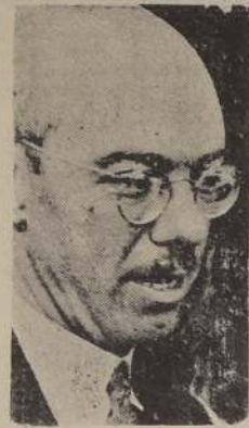
Doctor José María Velasco Ibarra

La República del Ecuador celebra hoy el aniversario de su emancipación política. Con este motivo se efectuarán en nuestra capital, los siguientes actos: A las 9 horas.—Se hará el pabellón ecuatoriano en la Embajada del Ecuador, Av. Lyon. A las 10 horas.—Homenaje a la Escuela Ecuador, Avda. O'Higgins, esquina Avda. España. A las 10.30 horas.—Acto conmemorativo en honor de Ecuador, en la Escuela Panamericana. A las 11 horas.—Se colocará una corona en el Monumento al Padre de la Patria, Gral. Bernardo O'Higgins. A las 11.30 horas.—Homenaje a la colonia ecuatoriana en el Liceo N.º 2 de Niñas, Av. O'Higgins. A las 14 horas.—Amistoso de fútbol entre los equipos ecuatoriano y colombiano. A las 18 horas.—Velada artística y literaria en la Universidad de Chile, Salón de Honor, organizada por el Centro Ecuatoriano y el Instituto de Cultura Chileno-Ecuatoriano. A las 20 horas.—Velada radial en cadena, desde la Radio Cooperativa, con las radios de Chile y el Ecuador, organizada por el Centro Ecuatoriano y su estudiantina de estudiantes. A las 21 horas.—Banquete y recepción en los salones del