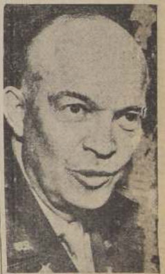
El general Eisenhower, coman- dante supremo de las fuerzas de invasión, quien ha trasladado su cuartel general desde Inglaterra a los campos de batalla del norte de Fran- cia

táculos importantes que cierren el paso hacia Paris.