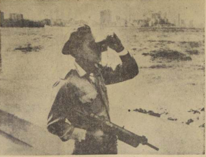
ESPERANDO LA INVASION QUE NO LLEGA: Un joven miliciano cubano escudriña el horizonte a fin de ver desde el primer momento las fuerzas expedicionarias norteamericanas que, según Fidel Castro, deber invadir la isla antes del 18 de enero.

Basos y demás antecedentes estarán a disposición de los interesados a contar del 11 de enero, en la secretaría del Departamento de Estudios de Caminos y Aeropuertos, diariamente de 10.30 a 12 horas.