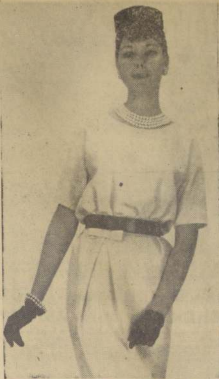
BLANCO Y NEGRO.— Vestido en shantung blanco, muy sencillo, con cinturón de charol negro. Guantes y sombrero negro. Es un modelo de Pierre Cardin.

EL DIRECTOR GENERAL DE LOS SERVICIOS DE LA ARMADA