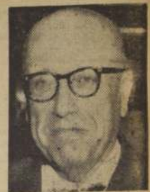
MINISTRO DE Relaciones Exteriores, don Germán Vergara Donoso.

● Alcances del Tratado de Montevideo conocerá el Senado esta tarde. ● El Canciller hará una exposición. ● "Constituye una defensa altamente eficiente para nuestro desarrollo agrícola", dice la Sociedad Nacional de Agricultores