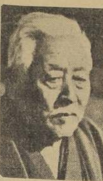
Almirante Makoto Saito, muerto asesinado

Mayores noticias de Tokio. El Gobierno tiene control. El Emperador Hirohito ha dictado las siguientes medidas de emergencia para la protección de la capital. 1) Entregar a manos militares el control de la ciudad y los alrededores. 2) El Gobierno ofrece garantías para la protección de la propiedad particular. 3) Una orden general a todos los ciudadanos para que se abstengan de salir a las calles. 4) El Gobierno ofrece garantías para la protección de la propiedad particular. 5) Una orden general a todos los ciudadanos para que se abstengan de salir a las calles.