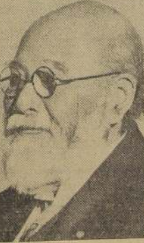
Ministro de Finanzas, Kore-kiyo Takahashi, asesinado