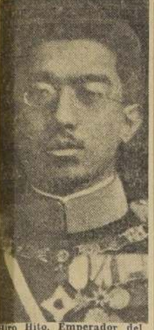
Hiro Hito, Emperador del Japon

EL PREMIER OKADA, EL MINISTRO DE FINANZAS, TAKAHASHI, EL GENERAL SUZUKI, EL GENERAL WATANABE Y EL ALMIRANTE MAKOTO SAITO, MURIERON ASESINADOS