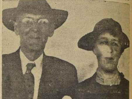
El señor Paul Harris, fundador del rotarismo internacional, que llegó ayer a Valparaíso acompañado de su esposa