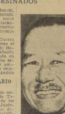
Barón Makino, ex-Canciller, que escapó milagrosamente

A las 2.30 de la madrugada se había ya ninguna información de la ciudad. En Tokio ni en Osaka, estando ambas ciudades perfectamente tranquilas. Oficialmente se anunció que solamente tres personas habían muerto en la mañana.