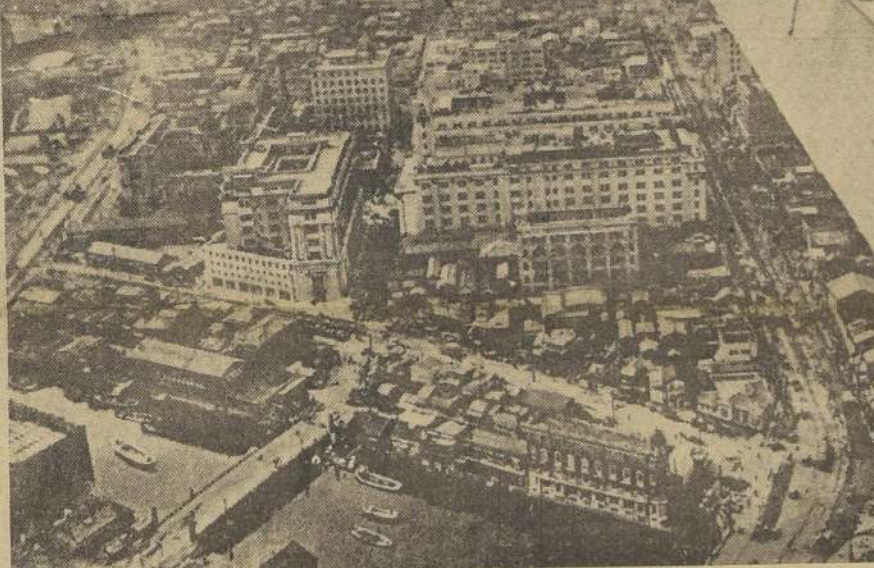
Vista de Tokio, la capital del Imperio, Nipón, teatro de los graves sucesos ocurridos ayer

LONDRES, 26. (U. P.)—El correspondiente de la Exchange Telegraph en Peking, dice que allí se rumorea que el Emperador Hirohito, ha estado virtualmente prisionero en su Palacio de Tokio, durante el golpe de Estado, pero que los japoneses bien informados de Peking, desmienten esto, diciendo que el movimiento es en favor de Su Majestad Imperial.