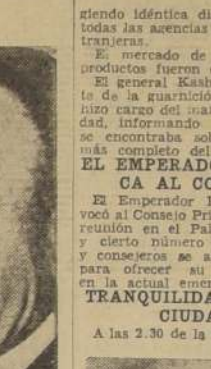
Barón Makino, ex-Canciller, que escapó milagrosamente

LONDRES, 26. (U. P.)—La Embajada del Japon recibió hoy un comunicado oficial de Tokio, confirmando que el