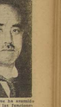
Barón Makino, ex-Canciller, que escapó milagrosamente

LONDRES, 26. (U. P.)—Hablando en la Cámara de los Comunes esta tarde, el Capitán Eden anunció, en su calidad de Ministro de Relaciones Exteriores, que el Banco del Japon había suspendido sus operaciones.