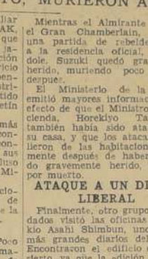
Barón Makino, ex-Canciller, que escapó milagrosamente

Finalmente, otro grupo de soldados visitó las oficinas de Tokio Asahi Shimbun, uno de los más grandes diarios del Japon. Encontraron el edificio casi desierto, ya que la edición matutina había salido a la calle.