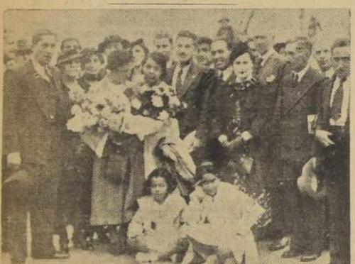
Anita Lizana que ayer partió a Europa, acompañada de sus admiradores y familiares

dijo Anita Lizana, momentos antes de partir para Europa.— La gran campeona chilena se embarcó ayer tarde en el "Reina del Pacífico"