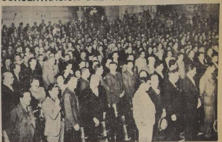
Parte de la numerosa concurrencia que asistió anoche al Teatro Caupolicán, a la concentración del comercio minorista de Santiago, en la cual se aborrieron interesantes problemas que interesan a este numeroso gremio