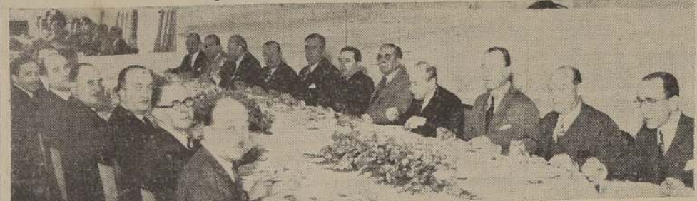
Asistentes al almuerzo ofrecido en honor del señor Charles Roditi, presidente de la Corporación Universal de Compras de Nueva York, quien nos visita para imponerse de las posibilidades de nuestro país para su comercio de exportación.

ducciones. Este país es inmensamente rico en recursos naturales y materias primas, de que muchos otros países americanos carecen, desgraciadamente se