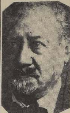
El recordado autor teatral don Adolfo Urzúa R., al cual se rendirá homenaje popular

El proyecto presentado al Congreso Nacional y lo relacionado con el perfeccionamiento universitario para mayor justificación de las peticiones formuladas por los practicantes en general.