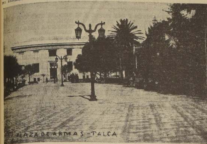
Un sector de la Plaza de Armas - Talca

Nuestra raza ha ido perdiendo, en los últimos tiempos, su vigor físico que era su característica más peculiar. Yo opto por que para lograr su restablecimiento físico hay que realizar una cruzada nacional deportiva, como medio de subsanar el abandono y a las tabernas.