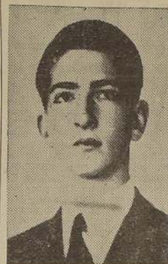
Pedro II, de Yugoslavia