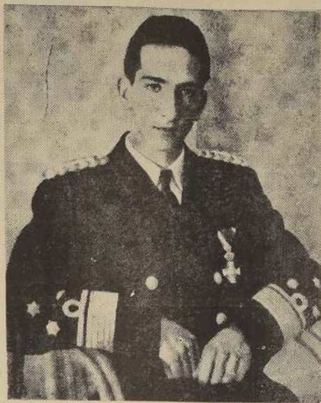
Una de las últimas fotografías de S. M. Pedro I, Rey de Yugoslavia, tomada poco después de huir a la capital de Inglaterra, donde se encuentra el Gobierno yugoeslavo.

Los Slovenos, luego de estar bajo la dominación de los prusianos, pasaron a la de Austria, pero ni los unos ni los otros, lograron la absorción de aquellos. En este sentido vale la pena mencionar, que durante varios siglos los Duques reynantes, de la casa de los Habsburgo, estuvieron obligados, al tomar posesión del país, a pronunciar durante la ceremonia respectiva ciertas fórmulas en lengua slovena. Si se considera que los Slovenos no pasan de un millón, resulta admirable y asombrosa la forma en que ellos resistieron a todas las imposicio-