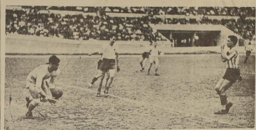
Una intervención fácil de Ledesma. Balbuena se aprestaba a intervenir; pero estaba muy distante del arquero argentino.