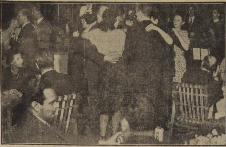
El "Florida", ubicado en el 17.º piso del Hotel Carrera, a la hora del aperitif dansant.