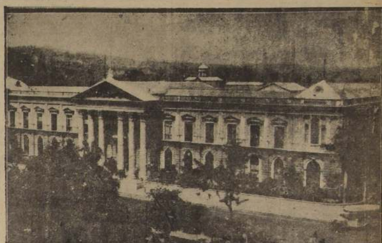
PALACIO NACIONAL de San Salvador, donde funcionan la Asamblea Legislativa, la Corte Suprema de Justicia y todas las secretarías de Estado.

Giral, al responder a los líderes de la oposición, declaró que el Gobierno "espera críticas, pero éstas deben ser fundadas en hechos y razones y no en meras suposiciones de debilidad del Gobierno". Rechazó la afirmación del comunista Uribe de que el partido comunista representa a pueblo español, diciendo: "Todos representamos al pueblo. Nosotros que formamos el Gobierno tenemos una mayor representación del pueblo". Agradeció a todos su colaboración a la restauración de la República, como así mismo de la libertad y la democracia para España.