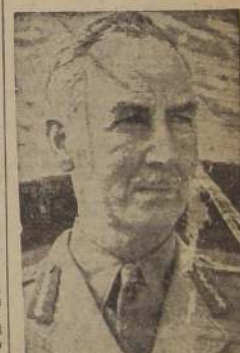
General Sir Alan Cunningham

LONDRES, 8. — (U. P.)— El Ministerio para las Colonias anunció esta noche que el teniente general Sir Alan Cunningham había sido designado Alto Comisionado en Palestina. Sucede a Mariscal de Campo Lord Gort, quien se retiró la semana pasada por motivos de salud.