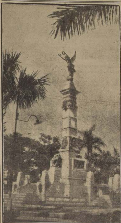
MONUMENTO A LA INDEPENDENCIA en la capital de El Salvador.

Pdte. Castañeda Castro le recibió en el aeródromo. — Homenaje del Congreso. — Hoy es esperado en Honduras