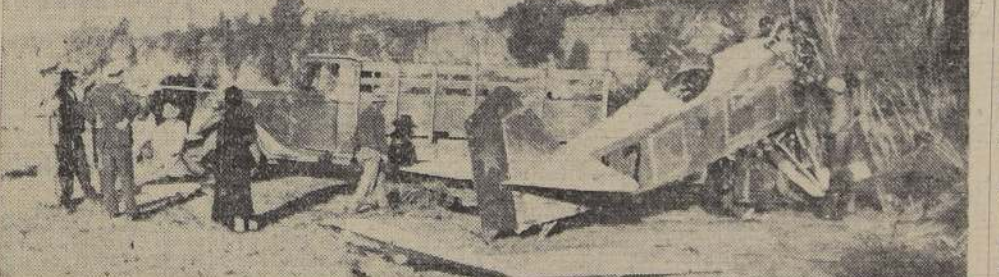
Como quedó el aparato después del accidente.

Recibió sus despachos de oficial de Ejército en 1927, pasando a la Fuerza Aérea en 1929. Ha sido ascendido a teniente 1.º en enero de 1934.