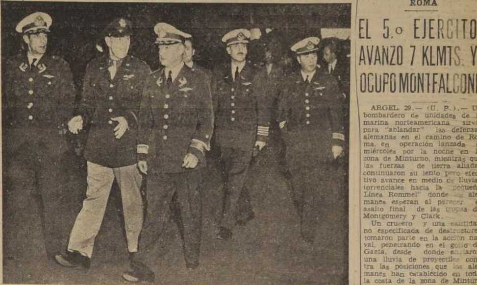
EN EE. UU. — El Jefe de la Fuerza Aérea de Chile, General del Aire don Manuel Tovarías quien a la sazón se encuentra en Estados Unidos, visita aquí una de las más importantes usinas aeronáuticas de la Unión, la de la Republic Aviation. Lo acompañan miembros de su comitiva y el Coronel T. A. Murphy, del Ejército de Estados Unidos