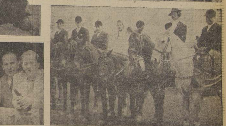
Diversos aspectos de la interesante jornada de paperchase cumplida ayer en Peñalolén

Pertenece ahora al finlandés Macki, con 30'2"