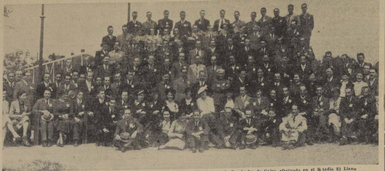
Durante las fiestas conmemorativas del sexto aniversario del Sindicato Profesional de Empleados de Cajas, efectuado en el Estadio El Llano

Asistió más de un centenar de socios y varios jefes de servicios públicos. — Los oradores. — Detalles de la manifestación realizada en el Estadio "El Llano". — Rol social del Sindicato y sus aspiraciones