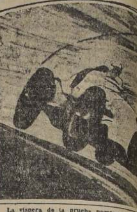
land, quien pilotó un Auto Unión de

En match de interés le venció por puntos por 17. — Magnífica presentación de Baquedano de Melipilla frente