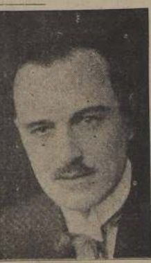
Sir George Lloyd

Las experiencias de Lloyd cubrieron un ancho campo: diplomacia, viajes, negocios prácticos en el gran banco que lleva el nombre de la familia, muchos años de vida parlamentaria, un variado y aventuroso servicio extraordinario en la guerra mundial, un íntimo estudio