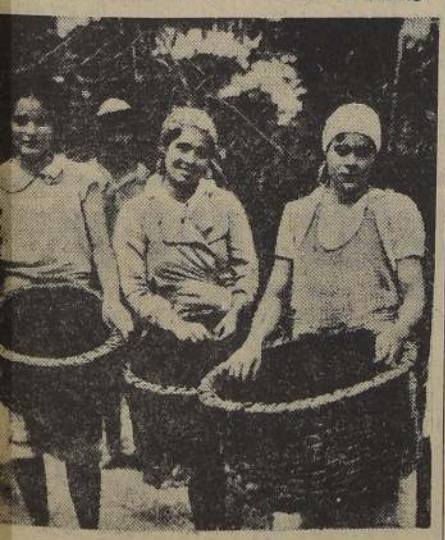
Las vendimiadoras se alistan para la faena

según la exposición y posición de la cepa. Los racimos de la base de la cepa son los que por lo general maduran primero, los que están más expuestos a la intemperie, lluvia, heladas, se conservan menos, pero regularmente son de mejor calidad, de peso relativamente mayor, y soportan con facilidad el transporte. En la vid las plantas más jóvenes son las que dan racimos primero. En la uva blanca, el racimo está a punto de ser cortado cuando los granos son claros, transparentes en toda su superficie. En las uvas para vino, la vendimia puede empezar cuando la coloración de la piel en las uvas negras, se cubre de pruna, y en las uvas blancas se torna elástica y el grano se torna tierno. La base del racimo comienza a lignificarse y tiene tendencia a inclinarse al suelo en razón del peso de la fruta. Los granos dueros y el pericarpio característico de cada variedad son factores que indican plena madurez.