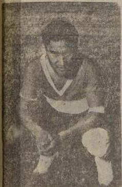
Vallejo, puntero izquierdo peruano

En cuanto al cuadro nacional ha mantenido un entrenamiento diario durante esta semana, y sobre su composición, aún cuan-