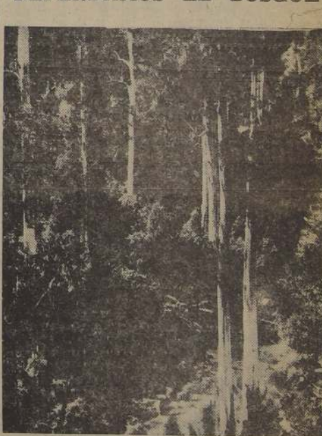
Los bosques constituyen la riqueza de un país

Los últimos ríos efectuados en el Sur del país, ponen de manifiesto la poca o ninguna apreciación humana sobre la importancia que el vegetal tiene sobre los intereses más inmediatos que representan la vida y trabajo del hombre. El hombre de campo debe tener grabado en su conciencia: 1.º Que tenemos tierras suficientes de cultivo para suplir las necesidades de una población mucho mayor y que por consiguiente, no es preciso destruir los bosques para transformarlos por ignorancia en tierras inútiles. 2.º Que el bosque es fuente de producción inapreciable, y representa una industria importantísima. 3.º Que el bosque influye favorablemente en el clima y en la cultura de un pueblo está en relación directa de su protección al árbol. 4.º Que como elemento de combustión forma la riqueza de un país. 5.º Que los bosques sostienen y purifican las aguas corrientes, estas sostienen los cultivos y las industrias que a su vez sostienen al hombre. 6.º Que la destrucción de los bosques en la forma que se ha venido realizando origina el desastre. 7.º Que olvidamos que nuestro espíritu, el que nos da el brio, el cansancio, el aliento, el libre, el maticón, la luna, el huaso, el roble, el lingue, el quillay, el acodé, el pelté y tantos otros han sido el alma de nuestra agricultura. Tengamos siempre presente la bella sentencia que dice "que la cultura de un pueblo está en relación directa de su protección al árbol".