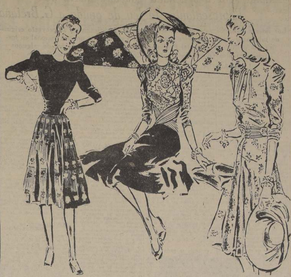
1.—Elegante y original este vestido con la blusa de crepe opaco en negro y falda plisada imprimé en fondo negro. 2.—Combinación contraria a la anterior con falda campana en crepe opaco negro y blusa imprimé drapada en la cintura. 3.—Imprimé en tonos claros con cintura de lo mismo, adornada de cintas grosgrain en los tonos del floreado.