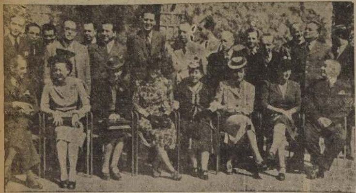
Asistentes al almuerzo en el San Cristóbal.