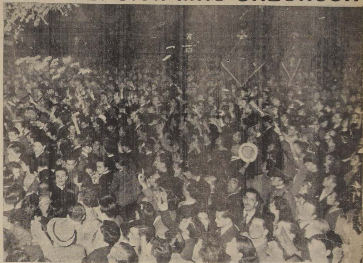
Miles de personas, estacionadas frente a la residencia de Mr. Wallace, le aplauden frenéticamente, saludándolo con el signo de la victoria

Tan pronto apareció Mr. Wallace en los balcones de su residencia, acompañado de S. E., para responder a los clamorosos llamados de la multitud que le pedía hablar, el ilustre huésped no pudo resistir a este deseo y con voz entera se expresó así: "Estoy completamente emocionado; nunca he visto una recepción tan calurosa que es el símbolo de las fuerzas de una verdadera Democracia. Miro a la Izquierda y a la Derecha, y veo todos los partidos que defienden la Patria y la Democracia en todo el mundo".