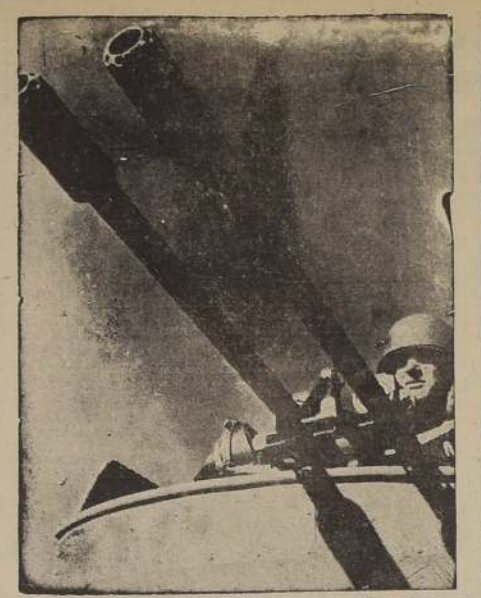
Las nuevas lanchas torpederas norteamericanas están armadas de un par de poderosas ametralladoras de 56 mm., de una gran rapidez de fuego, velocidad y poder de penetración.

Bombarderos Baltimore atacaron el empuje ferroviario