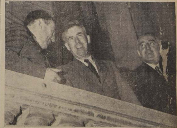
S. E. el Presidente de la República y el Excmo. señor Wallace, presencian desde los balcones del Club Militar el imponente espectáculo de la multitud

Nosotros compartimos con V. E. la esperanza profética de un mundo mejor regido por nuestro común Maestro, el adorable Jesucristo".