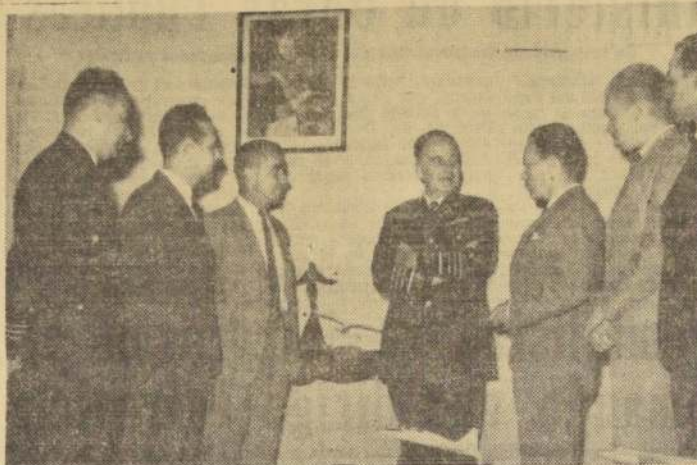
En la tarde de ayer, pasó a saludar al Comandante en Jefe de la Fuerza Aérea de Chile, General del Aire Eduardo Iensen.

En la tarde de ayer, la delegación de volovelistas chilenos que presentará a nuestro país, en el torneo internacional realizado en la República Argentina. El general señor Iensen tuvo palabras de elogio y estímulo para estos esforzados deportistas, que con escasos medios materiales, y solo por su espíritu de lucha están levantando el volovelismo chileno. Entre las performances dignas de destacarse en este grupo, figura la