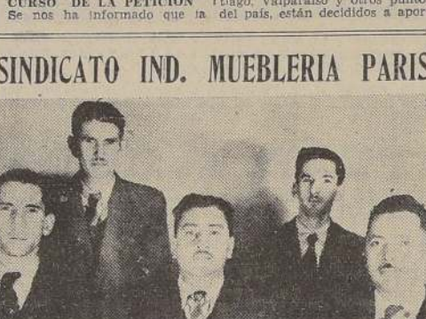
Miembros del nuevo directorio elegido por el Sindicato Industrial Obrero de la Mueblería Paris, progresista organización gremial

Gran remate de objetos varios DE LA SUCURSAL N.º 6 DE LA CAJA DE CREDITO POPULAR INDEPENDENCIA N.º 826 Préstamos concedidos en SEPTIEMBRE y OCTUBRE y vendidos en MARZO y ABRIL. HAY: máquinas de coser de mano, radios, máquina de moler carne, tocas, cristales, cuchillería, juego de lavatorios, monturas chilenas e inglesas, herramientas, maletas, paraguas, etc. A LA VISTA: el 16 todo el día. RENOVACIONES: hasta el 13 únicamente.