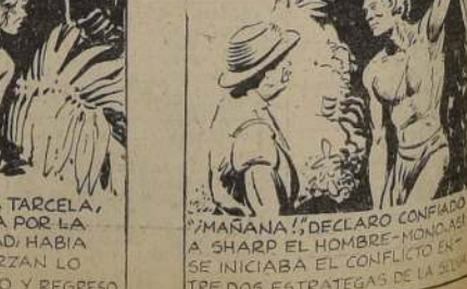
PERO YA TARZAN, PROTEGIDA POR LA OBSCURIDAD, HABIA MUNDADO. TARZAN LO COMPRENDIO Y REGRESO.