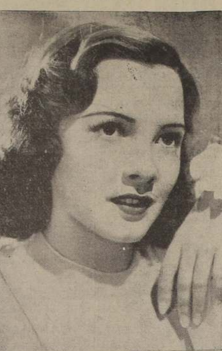
Kathryn Grayson, el nuevo "descubrimiento" de Hollywood; artista y cantante de dieciocho años, en su interpretación de secretaria de Andy Hardy, camina hacia el estrellato.

Una de las más entretenidas de las películas de la Familia Hardy es "La secretaria de Andy Hardy", que vuelve a reunir otra vez a ese simpático grupo de artistas con quienes tanto se deleitan grandes y chicos, y que mañana estrena el Metro.