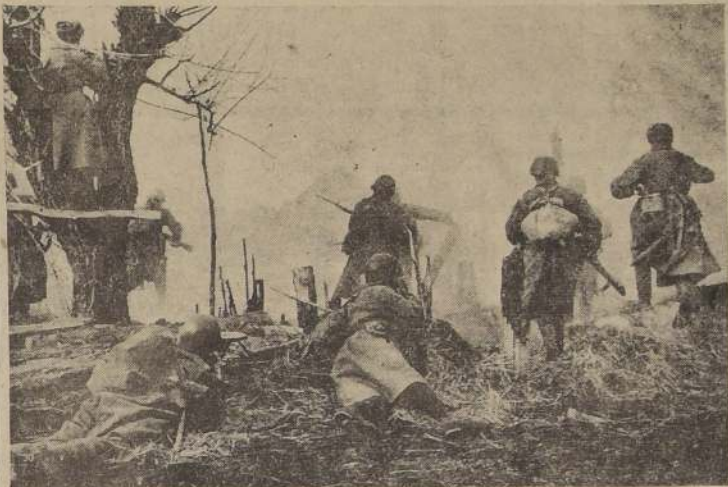
Fuerzas de infanterías rusas en el momento de lanzarse a la ofensiva en el sector central del frente.