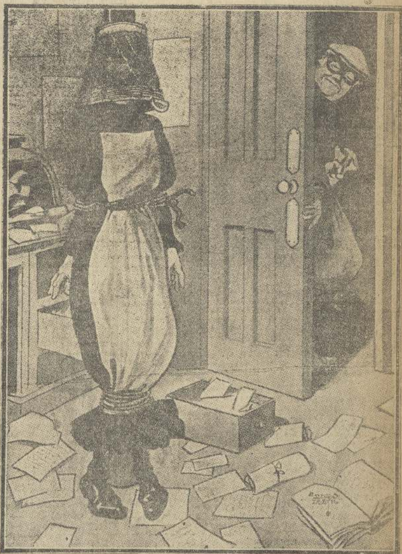
El Lastró.—Yo te he robado; pero no puedes quejarte, porque te dejó vestida a la última moda.

Esos son los personajes del drama con algunos otros, que sirven para dar más color local a la escena y distraer el diálogo.