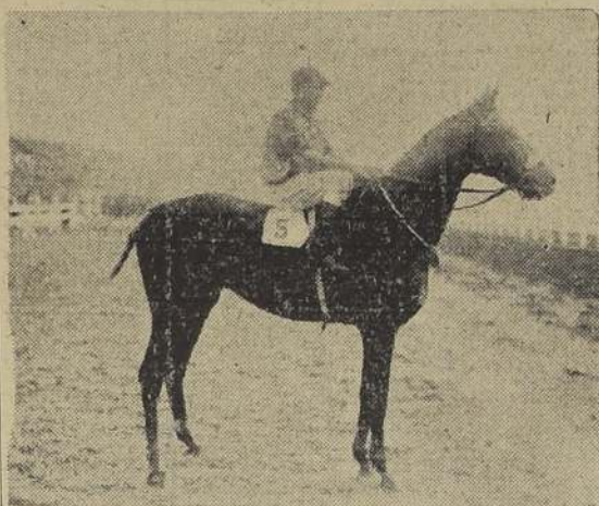
CHOP, nuestro favorito en el premio Guillermo Swinburn, prueba básica de la reunión extraordinaria de esta tarde en el Club Hípico

El "meet" es a beneficio de la Asociación de Paperchase de Chile, y lleva como prueba básica, el premio Guillermo Swinburn, sobre 1,800 metros.