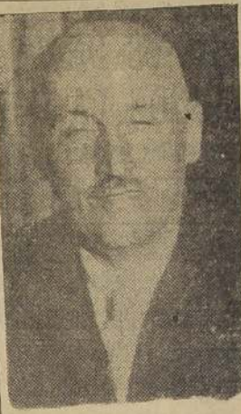
Conde Henry de la Vaulx

Los demás pasajeros subieron al aparato en Albany.—(U. P.)