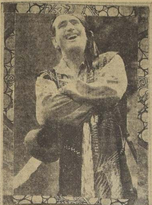
Esta película es presentada con equipo Genneth Sound; el más perfecto de cuantos hay llegado al país. Distingue con toda claridad las diferentes voces humanas.

PRODUCCION METRO GOLDWYN MAYER, PARA MAYORES; NO RECOMENDABLE PARA SEÑORITAS.