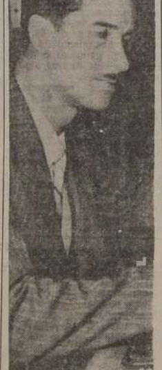
Don Adolfo Acevedo, Director General de Agua Potable y Alcantarillado.

Se nos dijo que el citado balance, en su parte esencial, es favorable, por cuanto permitirá conocer exactamente el monto del superávit del ejercicio financiero fiscal del año pasado, que, extraoficialmente ha sido calculado en más de 400 millones de pesos.