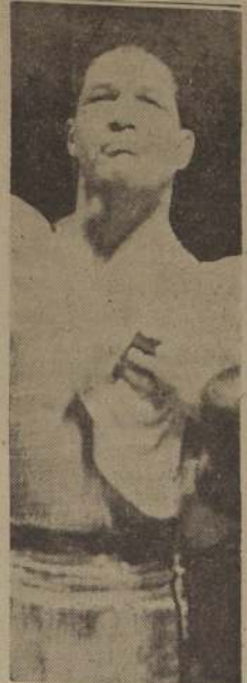
NO LE DIERON PASE. — El médico no le dio el pase a Arturo Godoy, y por lo tanto, su match de anoche con el belga Sys, debió suspenderse.

BUENOS AIRES, 10.—(UP).— Ha sido suspendido el match de esta noche entre el campeón chileno y sudamericano Arturo Godoy y el ex campeón europeo Carlos Sys, de nacionalidad belga. La decisión fue tomada por la comisión municipal de box, después de un examen médico de ambos boxeadores efectuado al mediodía, constatando en él, que el pugil chileno no se encontraba en condiciones físicas para subir al ring. No se ha fijado fecha para el combate. Arturo Godoy tiene una lesión sobre el ojo izquierdo que le imposibilita afrontar el compromiso que tenía para esta noche con el belga, según determinaron los médicos de la comisión municipal de Box. El informe médico, que es brevísimo, se limita a constatar la lesión de Godoy y a opinar que si se efectuara el match, el transandino no estaría en condiciones de resistir la violencia de los golpes que cambian entre los peso pesados. La fecha se fijará oportunamente, pero en círculos de la comisión se opinó que deberán transcurrir no menos de 30 días antes que pueda efectuarse el match. Esta es la segunda vez que se posterga el encuentro, debiéndose la anterior a una lesión que sufrió el chileno en una mano durante los entrenamientos. El empresario de la pelea, Simón Kronenberg, declaró a la United Press, que tiene proyectado conseguir una autorización para que la pelea se efectúe el 3 de marzo, y que tiene al argentino Lowell como suplente, para el caso de que Godoy o Sys no puedan presentarse.