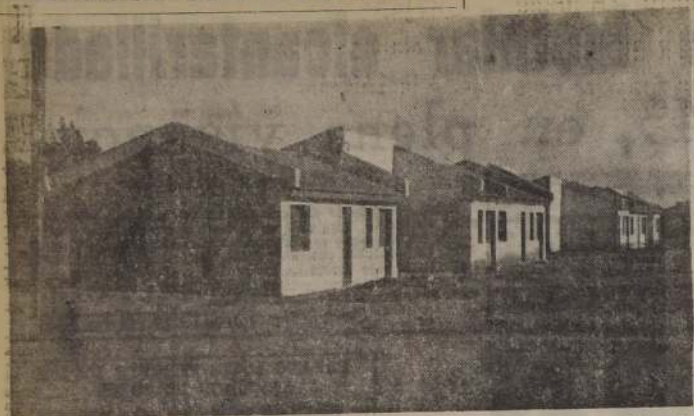
OBELACION QUE NO SE ENTREGA. — Tras dos años de estar terminadas su construcción, aún 5 están habiendo 22 casas de una población de los Ferrocarriles, ubicada en la calle Blanco Paredes, en la Quinta Normal. No tienen agua potable y su único morador es don Aldo Contreras Pérez, quien vive en Blanco Paredes 50, en compañía de su madre doña Amelia Lara viuda de Contreras. "Tenemos que ir a buscar el agua a cuatro cuadras", nos declaró. En las casas deshabitadas, que están totalmente entregadas al saqueo y pillaje por la ninguna vigilancia policial. En las, ajenas toda clase de vagos y maleantes, que han dejado estas casas en pésimas condiciones sanitarias.