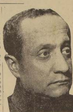
General Arturo Puga O.

En 1928 desempeñó la Intendencia de Tarapacá, y al año siguiente fue designado Ministro de Guerra en Colombia, cargo que desempeñó con gran acierto. En julio de 1930 fue acreditado como Embajador Extraordinario para concurrir a la transmisión del mando presidencial en el mismo país. Vuelto a la patria, tuvo una actuación destacada en las incidencias políticas de 1932, co-