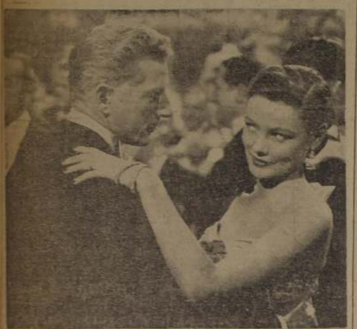
Danny Kaye y Gene Tierney en una escena de "Escándalo en la Costa Azul".

"Escándalo en la Costa Azul", es una producción de la 20th Century Fox, que estrenará el próximo jueves en el Teatro Rex, fue filmada en las hermosas playas de la Riviera Francesa, en tecnicolor, y en auténticas escenas naturales. Danny Kaye, Gene Tierney y Corinne Calvet son las estrellas principales de este film.