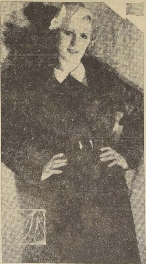
CHAQUETAS DE PIEL

Sencilla chaqueta de piel de poto, de líneas rectas y absolutamente severas.