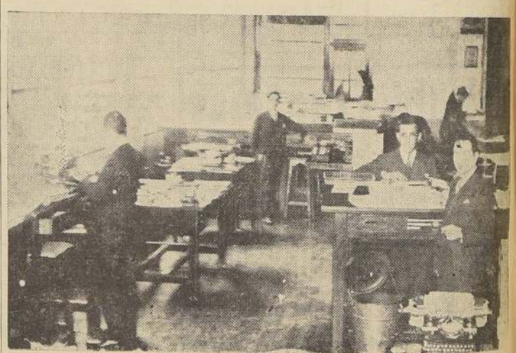
Otra de las oficinas principales

do manifestarles que en un principio fueron sólo un reflejo de la natural incertidumbre del público ante los acontecimientos políticos que