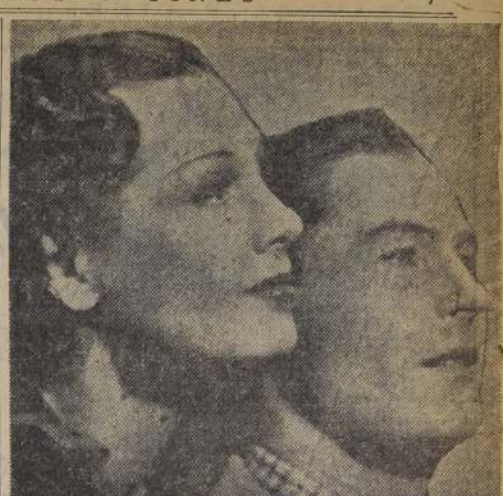
Gladys Swarthout, la bella cantante norteamericana, y el tenor Jan Kiepura, forman la pareja central de la película "Bell Canto" o "Give us this night", de la Paramount, la primera cinta animada en los Estados Unidos por el celebrado tenor polaco.

ciones a viva voz en castellano por el Doctor López. El acto ha sido dedicado al Alcalde de Santiago, señor Valencia, regidores y jefes de la corporación, al Deca-