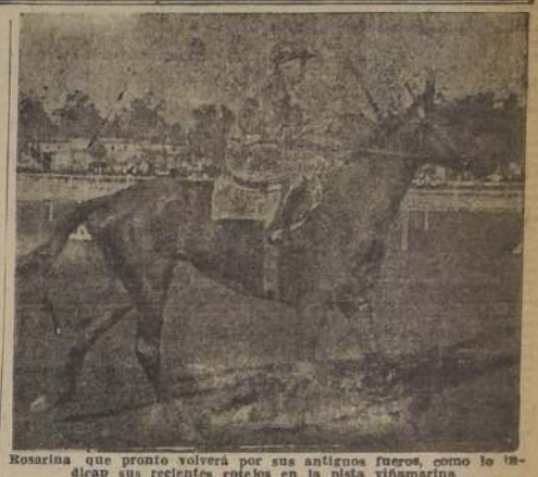
Rosarina que pronto volverá por sus antiguos fueros, como lo hizo sus recientes colegas en la pista viñamarina

ELIXIR REDUCTOR Es la más aparente para la digestión. Ayuda la digestión después de las comidas. Estómago enfermo: acudir al Elixir Reductor es su salvación.