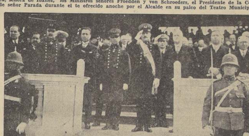
S. E. el Presidente de la República y Ministros durante la revista de ayer.

Antonio, Baños, Cauquenes, San Fernando, Talca, Chillán, Concepción, Angol, Temuco, Valdivia, Puerto Montt y Ancud.