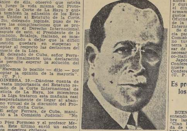
Dr. José Figueres ALCORTA

BUENOS AIRES, 19. — El ex-Presidente de la República, señor José Figueres ALCORTA, el miembro