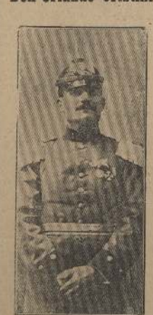
— Ayer en Santiago

civilización, el Gobierno comprendió la obra inhumana de arruinar, someter al indígena hasta dejarlo en la condición de hoy. Y lo que no alcanzaron a hacer los Poderes Públicos, se encargaron de llevar a cabo los colonizadores que vinieron a estas regiones, teniendo muchas veces como armas, los vicios, entre ellos el alcoholismo, que sembraron en el pueblo. Es así como esta raza en vez de tener medios de civilización se lo robó a la miseria y a la ignorancia. No es momento de recordar estos hechos, se instalan