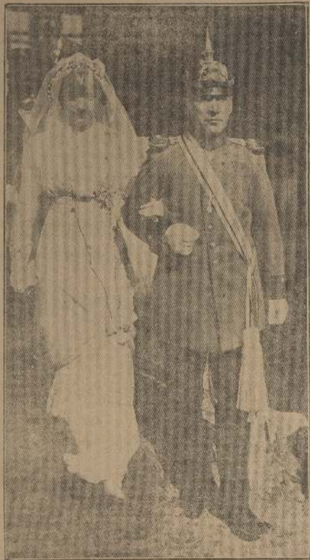
Los novios saliendo de la capilla de los Padres Franciscos