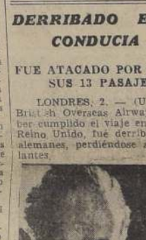
El almirante Alexander.