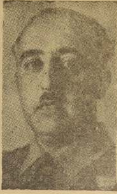
El Generalísimo Francisco Franco, que hoy pronunciará un discurso que se espera con expectación en España.

La sesión de apertura del Parlamento, a las 10.30 horas de maña-