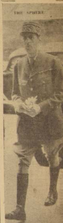
El general Charles de Gaulle, quien declaró que llegaría al Poder sólo por la legalidad, y nunca por la fuerza.