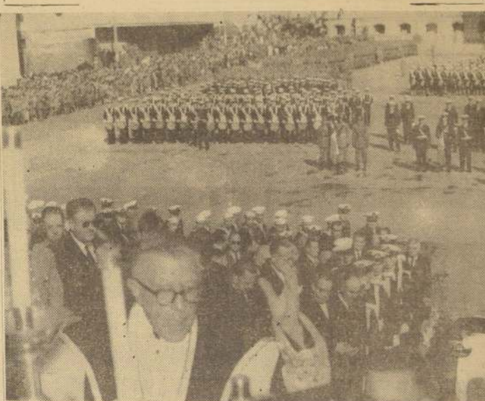
Valparaíso rindió un postor y póstumo homenaje al último testigo de la Epopeya de Iquique, durante el sepelio. En el grabado, las fuerzas navales y militares formadas en los funerales del vicealmirante don Wenceslao Vargas.

EN LOS FUNERALES DEL VICEALMIRANTE VARGAS.—