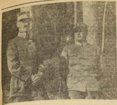
El Rey Olav V, de Noruega, cuando era príncipe heredero, junto a su padre, el Rey Haakon VII, quien fue llamado al trono en 1905, cuando se independizó el país.