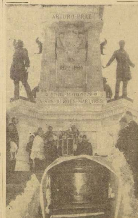
El Obispo de Valparaíso, Monseñor Rafael Lira Infante, oficia una misa al pie del monumento a los Héroes de Iquique en cuya cripta fue colocada instantes después la urna con los restos del vicealmirante Vargas.

INTERMINABLE DESFILE ANTE EL FETTERO.— A pesar de la insistente lluvia que cayó durante casi toda la noche, se verificó ante el féretro del glorioso grumete, un interminable desfile de los habitantes de Valparaíso y pueblos vecinos, que concurrieron a dar el último adiós a la noble reliquia de la Patria.