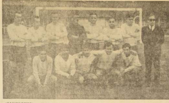
¡CAMPEONES! — EMPART demostró espíritu de lucha y deseos de triunfo, que le permitieron obtener el galardón máximo bancario, actuando con solo ocho jugadores.