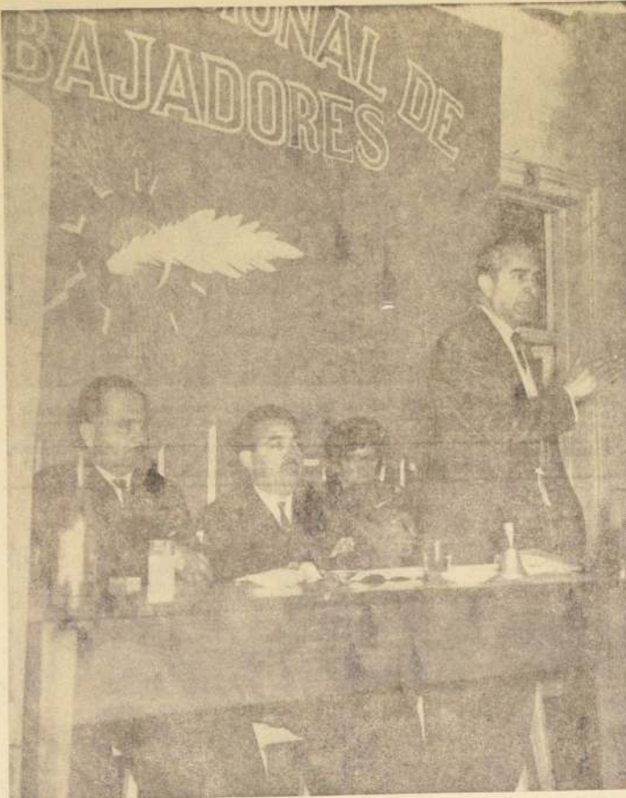
UNA AMPLIA y documentada exposición sobre los alcances y materias fundamentales que abarca el proyecto de Reforma a la Seguridad Social, elaborado por el Ejecutivo, hizo ante dirigentes gremiales del PDC reunidos en el local del Comando Nacional de Trabajadores, el Ministro del Trabajo y Previsión Social, William Thayer Arteaga. EN EL GRABADO: el Ministro Thayer informa sobre el proyecto de prestaciones familiares. Lo acompaña, a su derecha, el diputado Santiago Pereira, presidente del Comando, y otros dirigentes.

Por otra parte, este hecho tiene una enorme importancia para el país, porque asegura una entrada de divisas al año que puede estimarse entre el 10 y el 15 por ciento de toda la exportación industrial chilena. En efecto, estas 5.355 toneladas producidas en un mes, al precio medio de US$ 155, la tonelada, representan una entrada mensual de US$ 830.125, o sea, más o menos unos US$ 10.797.500 al año. Como unidad económica, Industrias Forestales S.A.C.P., de ocupación a 323 empleados y 401 obreros, incluyendo el personal que trabaja en los fundos, aparte de que ha llevado la prosperidad a una región que no tenía expectativas ciertas de progreso.