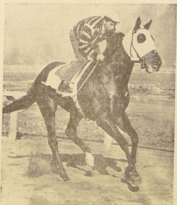
IA LA MANO PALMEÑA!

En el Hipódromo Chile: SUN REN, GRAN MONA, NATTY, NEGUS, DRAMATICA, TOYOTET tres puntos cada uno, PATO, BATICA, AMOTINADA y JACKSONVILLE, cuatro puntos, FAROLLO, cinco puntos, y PEPIN LE BREF, 6 puntos.