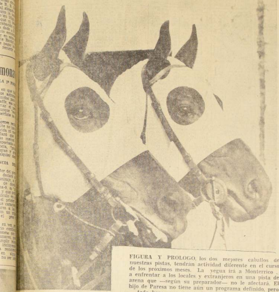
FIGURA Y PROLOGO, los dos mejores caballos de nuestras pistas, tendrán actividad diferente en el curso de los próximos meses. La yegua irá a Monterrico a enfrentar a los locales y extranjeros en una pista de arena que —según su preparador— no le afectará. El hijo de Paresa no tiene aún un programa definido, pero todo hace pensar que no tardará en reaparecer.