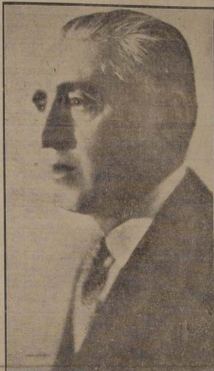
Don Juan Antonio Ríos, candidato a la Presidencia de la República, que recibirá hoy una vez más el homenaje del pueblo

Chile se ha levantado para pronunciar estas palabras: Democracia, Juan Antonio Ríos. LA VOZ DEL CANDIDATO No obstante la ardua labor que ha debido desarrollar durante estos últimos días el candidato de la Democracia, don Juan Antonio Ríos, se hará presente en la tribuna para hablar al pueblo sobre su Gobierno a base de libertad, reivindicaciones al amparo de la ley, justicia social, paso a las más capaces, honradas administrativas. Podrá en esta ocasión el pueblo oír de labios de su candidato palabras que no sólo serán tales, sino que se convertirán en realidad, por las que la promesa de un hombre jamás en su vida política ha dejado de cumplir sus promesas y porque tiene las condiciones de carácter, necesidad para hacer un Gobierno enérgico sin recurrir al fraude.