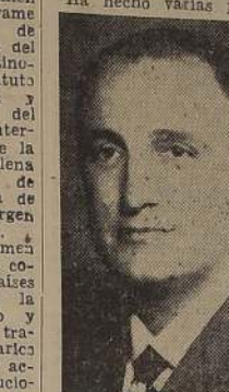
Sr. Divico A. Fumkorn

go intervino en distintas formas en las visitas de los Presidentes de Brasil y de Paraguay y en las negociaciones de la paz del Chaco. Posteriormente fue subsecretario en el Ministerio de Relaciones Exteriores y Culto. Ha hecho varias publicaciones sobre el desenvolvimiento interamericano, entre las cuales se destacan las denominadas "Panamericanismo Económico", y "Creación de un Ente Oficial de Economías y Fuerzas Vivas para colaborar en la Consolidación Económica Panamericana".