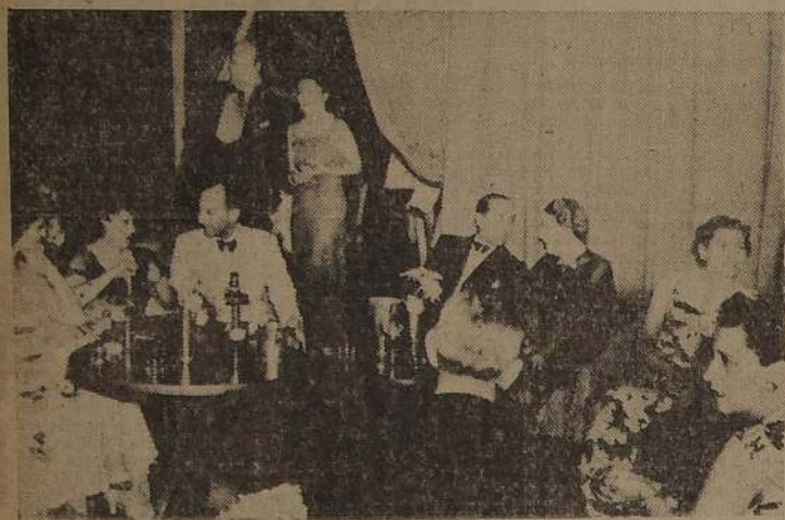
Algunas distinguidas familias asistentes al "Baby Bar" del Hotel Carrera, que constituye la atracción de las noches santiaguinas.