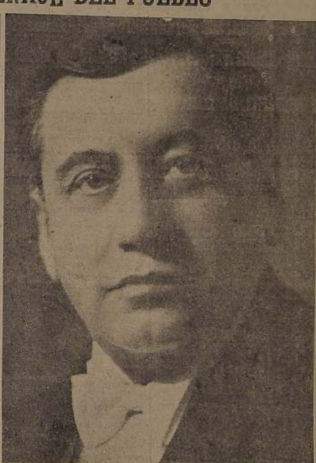
El ex Presidente de la República, señor Arturo Alessandri Palma, que hoy hará uso de la palabra en defensa de la democracia, amenazada por el fascismo

A fin de que los menores detalles de esta magna demostración de civismo sean conocidos en todos los hogares del país, se ha organizado una perfecta cadena de transmisiones radiales que estará en condiciones de hacer escuchar los promeseros de la Marcha de la Democracia y los discursos en todo el territorio. La transmisión comenzará a las 8.30 P. M. y terminará a las 11.1 P. M. y se hará por los micrófonos de las radios Americanas. El Pacífico y Estel de Santiago, las cuales están en condiciones de hacerse oír en todo el país y de permitir la transmisión de las Estaciones de los rincones más apartados de la República.