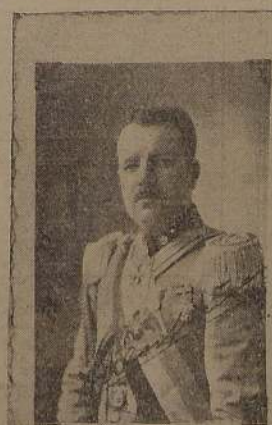
Es el Poder del Pueblo. Será el Pueblo en el Poder.