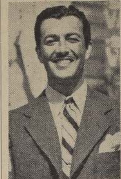
Robert Taylor, protagonista de la película "Galante y Audaz", que estrenará el próximo viernes el Teatro Metro y cuyas canciones se transmitirán mañana en una audición radial.

Este audición radial, que escucharemos mañana a las 21 horas, por intermedio de la Estación de Radio "La Americana", es como una original sinopsis de la parte musical que encierra la producción "Galante y Audaz". Este notable, producción Metro Goldwyn Mayer, como lo hemos anunciado, se estrenará en las funciones del próximo viernes, en el Teatro Metro. trata de una emotiva historia de amor y aventura protagonizada por el idolo Robert Taylor.