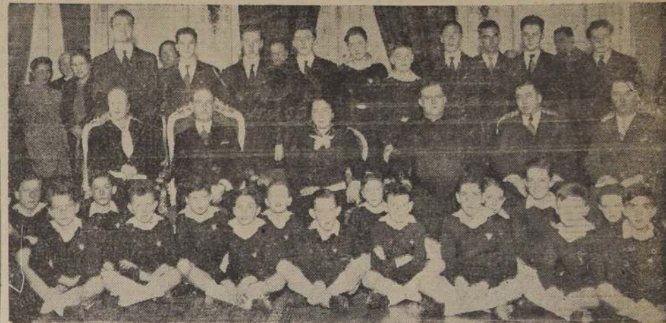
Los niños cantores durante la visita que hicieron a la esposa de S. E. señora Juana Aguirre de Aguirre Cerda

Ayer, a las 17 horas, los Niños Cantores de la Cruz de Madera de Francia hicieron una visita de cortesía a la esposa de S. E. señora Juana Aguirre de Aguirre Cerda.