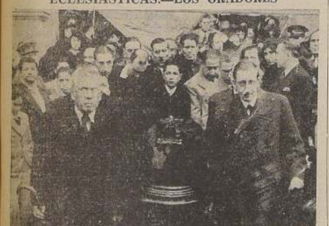
La urna es sacada de la Iglesia Catedral

SE OFICIO UNA MISA SOLEMNE EN LA CATEDRAL. — CONCURRIERON LAS AUTORIDADES ECLESIASTICAS. — LOS ORADORES