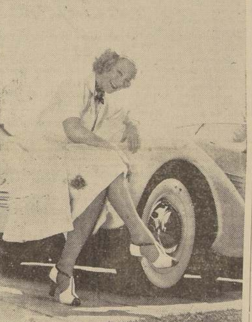
Sonia Henie, la gran actriz noruega, campeona olímpica de patin sobre hielo, protagoniza la graciosa revista musical "Una en un millón"

El Teatro Metro en el deseo de presentar para el año 1937, solamente estrenos de grandes producciones cinematográficas, ha firmado un contrato en New York con la 20th Century-Fox, que le permitirá estrenar, en el curso del presente año, un gru- po seleccionado de grandes pro- ducciones de esta acreditada marca. Estas producciones uni- das a las grandes películas Me- tro-Goldwyn-Mayer darán al Teatro Metro el más grande valor artístico y comercial del año. La próxima semana, el vien- es 12 del presente, se presen- tará la primera película de la 20th Century-Fox. Se trata de la obra "Una en un millón", es- trenada hace pocas semanas en New York con uno de los éxi- tos fantásticos de la tempora- da. Esta película, la más gra- ciosa revista musical rodada bajo la dirección de Sidney Lan- field, trae como atracción prin- cipal el nombre de Sonia Hen- ie, la famosa campeona olímpica de patin sobre el hielo, y cuyo retrato ilustra estas líneas. Don Ameche, actor joven que actualmente es la sensación de Hollywood, junto con Jean Hers- holt, Ned Sparks y otros for- man la plana mayor de sus principales intérpretes. Sobre esta película, dice Gualtel, crí- tico de cine-mundial, en el úl- timo número de esta revista: "...hay para reír más que en muchas cintas que presumen de humorísticas... Recomendando la cinta a derecha y a izquierda".