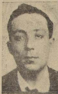
Don Justiniano Solomayor, radical, a diputado por el tercer distrito