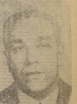
Don Manuel Chaparro, independiente, a diputado por Magallanes