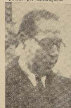
Don Eduardo Alessandri, liberal, a senador por Tarapacá y Antofagasta