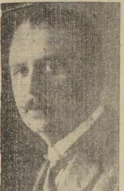
Don Pedro Freeman, radical, a diputado por Bio-Bio