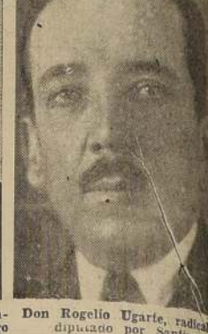
Don Rogelio Ugarte, radical, a diputado por Santiago