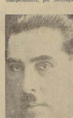
Don Héctor Rodríguez de la Sota, conservador, a senador por O'Higgins y Colchagua