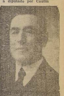
Don Alfonso Bórquez P., radical, a senador por Valdivia, Chiloé y Magallanes