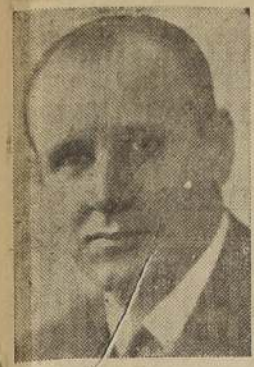
Don Ferrnando Alessandri, liberal, a senador por Tarapacá y Antofagasta