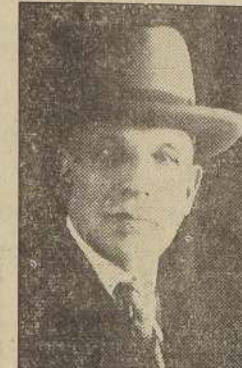
Don Pedro Opitz, radical, a senador por Tarapacá y Antofagasta