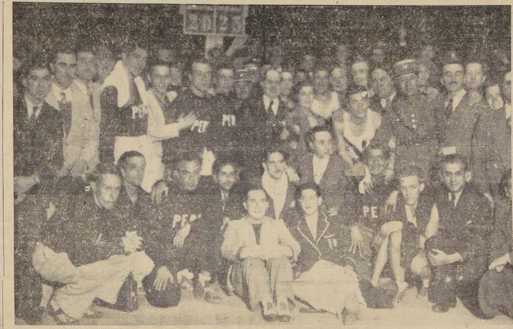
La delegación peruana de basketball posa para "LA NACION" rodeada de sus compatriotas y admiradores después de la victoria sobre Argentina en el match de anoche. Puede verse el tablero que marca el score del partido