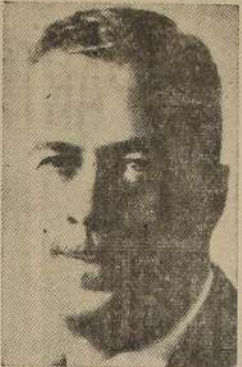
Don Miguel Cruchaga, conservador, a senador por Tarapacá y Antofagasta