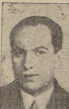
Don Rurecindo Ortega, radical, a diputado por Cautín