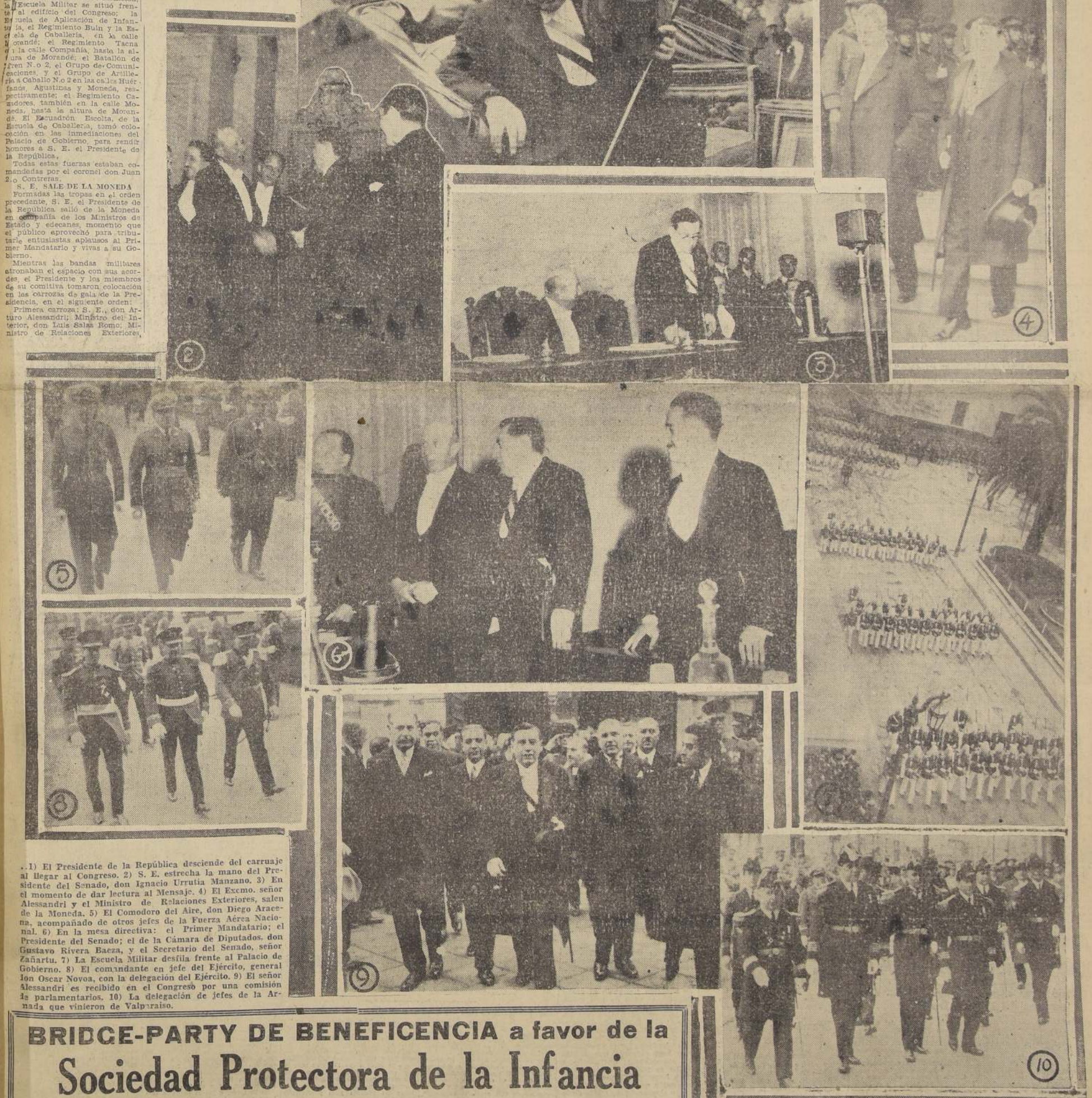
1) El Presidente de la República descendiendo del carruaje al llegar al Congreso. 2) S. E. estrecha la mano del Presidente del Senado, don Ignacio Urrutia Manzano. 3) En el momento de dar lectura al Mensaje. 4) El Excmo. señor Alessandri y el Ministro de Relaciones Exteriores, salen de la Moneda. 5) El Comodoro del Aire, don Diego Aracena, acompañado de otros jefes de la Fuerza Aérea Nacional. 6) En la mesa directiva: el Primer Mandatario; el Presidente del Senado; el de la Cámara de Diputados, don Gustavo Rivera Baez, y el Secretario del Senado, señor Zañartu. 7) La Escuela Militar desfila frente al Palacio de Gobierno. 8) El comandante en jefe del Ejército, general don Oscar Novoa, con la delegación del Ejército. 9) El señor Alessandri es recibido en el Congreso por una comisión de parlamentarios. 10) La delegación de jefes de la Armada que vinieron de Valparaíso.

LA SESION PLENARIA Damos en seguida la versión oficial de la primera sesión del