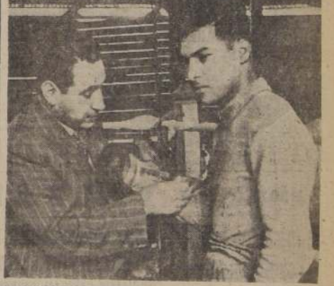
Nómina de las delegaciones que vienen al torneo de basquetbol

QUE SE INICIA EL 18 EN LA CANCHA DEL FAMAE