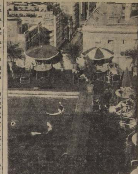
Aspecto tomado en la piscina ubicada en el 17.º piso del Hotel Carrera, que ha iniciado con todo éxito su temporada del presente verano.