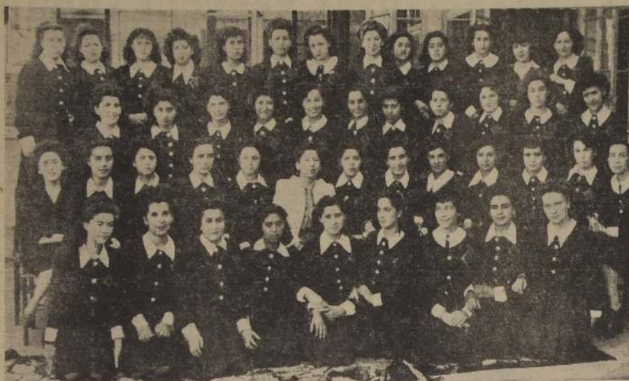
Grupo de alumnas de la Escuela Normal N.º 2, que hoy