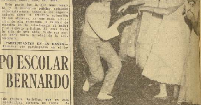
Las alumnas del Liceo N.º 8 celebraron ayer el noveno aniversario de la fundación de ese establecimiento educacional. En el grabado, una escena representada por el elenco de ballet, titulada "Infancia y Adolescencia".