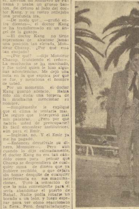
LADY DOCKER EXPULSADA DE MONACO. — Un comunicado oficial del Principado de Mónaco dio a conocer hace algunos días que se había cursado un decreto de expulsión del territorio monégaco "contra Lady Docker, que se entregó públicamente a manifestaciones contra el Principado". Furiosa por el hecho de que su hijo no hubiera sido invitado al garden-party organizado con ocasión del bautizo del Príncipe Alberto, Lady Docker procedió, en un hotel del Principado, a romper una bandera monégaca que estaba sobre una mesa. Aquí vemos a Lady Docker y su hijo, a su llegada a Cannes, Francia. —.

—Nada que no sea la muerte del Dr. Kang dejará satisfecho al Emir por la pérdida de la persona inglesa —dijo Monsieur Charap—. Durante varias semanas, el Emir había llevado consigo una fotografía de la muchacha. —¿Quiere usted que yo calme su desagrado? —Naturalmente —dijo Monsieur Charap, en tono salvaje—. Esto se construye con facilidad. Dígame, ¿cuál es el número de la pieza del Dr. Kang en el hotel? —Está en el mismo piso que la mía. Número diez. —Entonces esta noche iré a visitarlo. Será fácil sobornar al mucamo nocturno para que facilite una llave. Deje que todo corra por mi cuenta. Todo saldrá bien, y cuando esté muerto es posible que el Emir, que no siente ninguna simpatía por