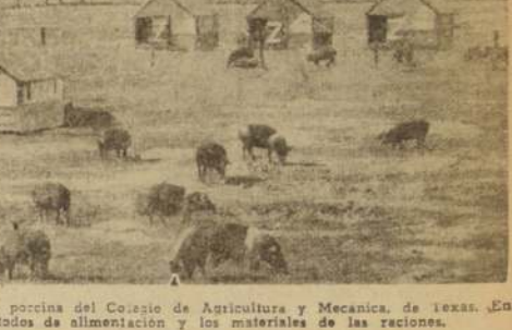
En la Estación de Experimentación de Cerdos de la Universidad de Texas, se estudian diversos métodos de alimentación y los materiales de las raciones.

Los estudios realizados en la Estación de Experimentación de Cerdos de la Universidad de Texas, han demostrado que la alimentación adecuada es el factor más importante para el desarrollo y la salud de los cerdos. Los cerdos que reciben una alimentación adecuada, crecen más rápido y alcanzan un mayor peso que los que reciben una alimentación deficiente. Los estudios realizados en la Estación de Experimentación de Cerdos de la Universidad de Texas, han demostrado que la alimentación adecuada es el factor más importante para el desarrollo y la salud de los cerdos. Los cerdos que reciben una alimentación adecuada, crecen más rápido y alcanzan un mayor peso que los que reciben una alimentación deficiente. Los estudios realizados en la Estación de Experimentación de Cerdos de la Universidad de Texas, han demostrado que la alimentación adecuada es el factor más importante para el desarrollo y la salud de los cerdos. Los cerdos que reciben una alimentación adecuada, crecen más rápido y alcanzan un mayor peso que los que reciben una alimentación deficiente.