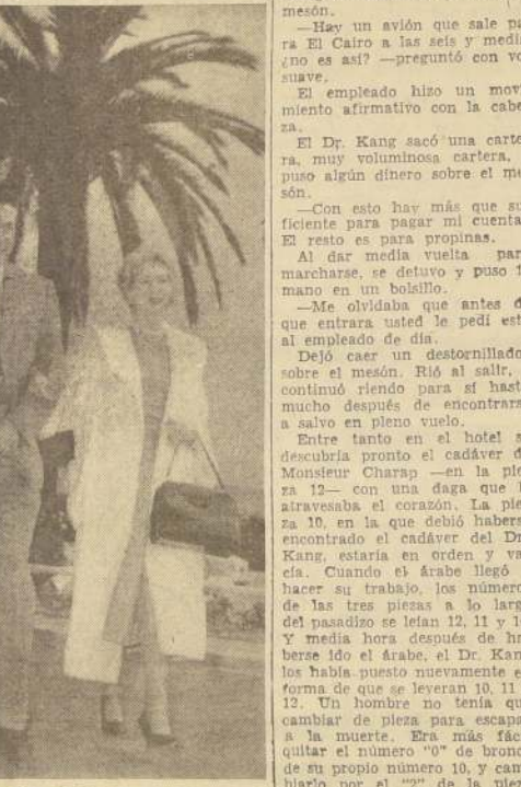
LADY DOCKER EXPULSADA DE MONACO. — Un comunicado oficial del Principado de Mónaco dio a conocer hace algunos días que se había cursado un decreto de expulsión del territorio monégaco "contra Lady Docker, que se entregó públicamente a manifestaciones contra el Principado". Furiosa por el hecho de que su hijo no hubiera sido invitado al garden-party organizado con ocasión del bautizo del Príncipe Alberto, Lady Docker procedió, en un hotel del Principado, a romper una bandera monégaca que estaba sobre una mesa. Aquí vemos a Lady Docker y su hijo, a su llegada a Cannes, Francia. —.