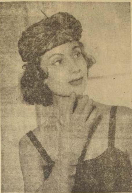
Elegante turbante de seda estampado en diferentes tonos verde y azul, perteneciente a la colección Maud de París.