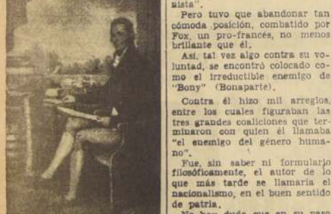
William Pitt Jr. en su despacho de Downing Street. — Dibujo de H. Edridge, 1891.