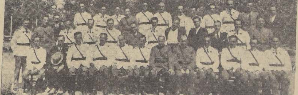
Asistentes al almuerzo de ayer en El Llano, con que fueron despedidos los oficiales alumnos del Segundo Curso de Ingenieros Militares. A esta fiesta concurren los generales Novoa, Ponce, Fuentes y Contreras, el coronel Argomedo y numerosos otros jefes militares