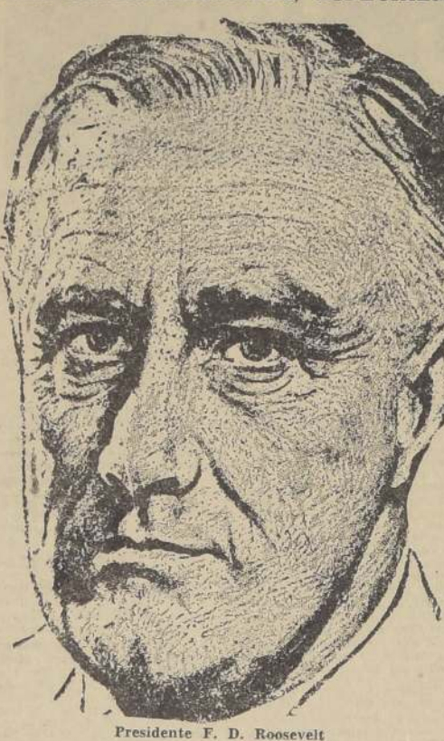
Presidente F. D. Roosevelt

LONDRES, 4. — El semanario "Economist" publica un comentario en el que dice lo siguiente: "El salitre chileno cubrió el 8.5 por ciento del consumo mundial de 1933-34, calculado en un millón 562.106 toneladas métricas, contra el 22.4 por ciento el año 1928-29. Pero el consumo de salitre chileno está aumentando, presente. Como actualmente hay un acuerdo concluido con los chilenos y con los productores japoneses de sulfato de amonio, siempre que el mejoramiento de la demanda no se vea ahogado por un poco sabio aumento de los precios". — (U. P.)