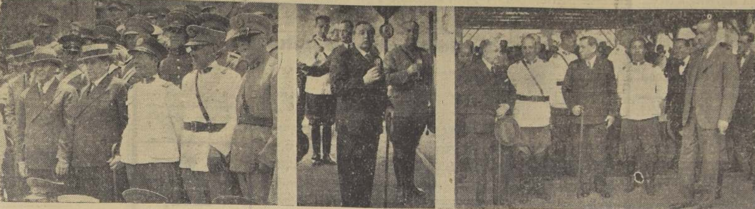
Diversos aspectos del homenaje de Carabineros a S. E. el Presidente de la República

Brillantes caracteres adquirió el desfile de ayer en la Escuela del Cuerpo en honor del Excmo. señor Alessandri. --Asistieron altos jefes del Ejército, Armada, Aviación y Carabineros