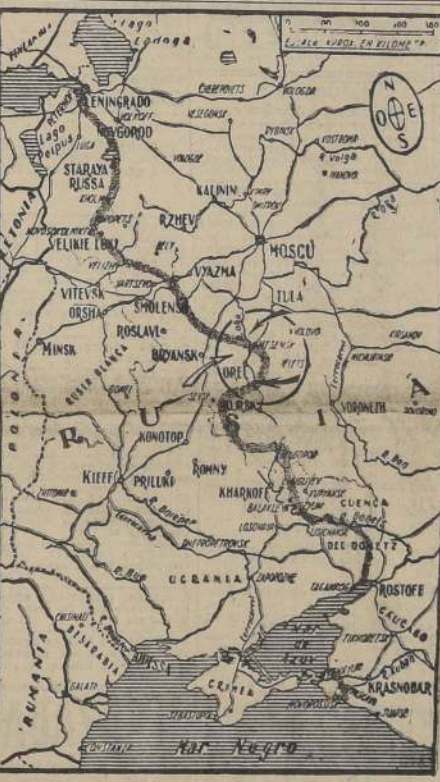
El presente mapa destaca la ubicación de la ciudad de Orel conquistada por los rusos, lo mismo que Belgorod, más al Sur. Estas victorias del ejército rojo, ponen en peligro a Bryansk y Smolensk, cuya posesión para los alemanes, es vital para el desarrollo de las operaciones en este frente.

La reunión del Gabinete y otras medidas tomadas durante el día pusieron de manifiesto la forma total en que el fascismo y todas sus características están siendo extirpados, pero los despachos que llegan desde la frontera indican que el pueblo italiano está ahora mucho más interesado en la paz que en el punto de vista del cadáver del fascismo. Hay noticias cada vez más abundantes de que el Gobierno toma una actitud abierta, y que el Rey Víctor Manuel.