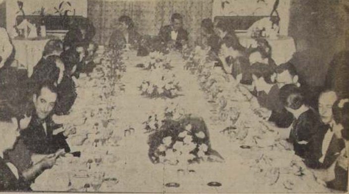
Comida ofrecida por el coronel Harold J. Pearson, de la Embajada de los Estados Unidos, a un grupo de sus relaciones sociales