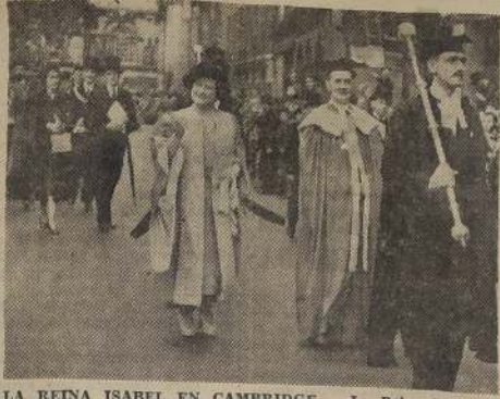
LA REINA ISABEL EN CAMBRIDGE. — La Reina Isabel fue a Cambridge a recibir el diploma e insignias de Doctor en Leyes. "honoris causa", inaugurando así la nueva época de esta vieja Universidad que ahora permite que las mujeres reciban grados universitarios.

MEXICO, 18.—(U. P.).— La poeta chilena Gabriela Mistral está recuperándose del ataque cardíaco que sufrió el martes en la mañana. Los médicos dicen que el peligro de muerte ha pasado. Ella podrá reanudar sus actividades dentro de poco. La poeta llegó a la ciudad de México el 12 de noviembre. Ella viajó a la ciudad de México, accediendo a la invitación del Presidente Miguel Alemán. Ella viajó a la ciudad de México, accediendo a la invitación del Presidente Miguel Alemán. Ella viajó a la ciudad de México, accediendo a la invitación del Presidente Miguel Alemán.