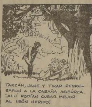
TARZAN, JANE Y TIKAR REGRESARON A LA CABAÑA ARDIENTE. ¡ALLÍ PODÍAN CURAR MEJOR AL LEÓN HERIDO!