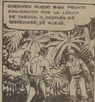
CHEDWICK QUEDÓ BIEN PRONTO CONVENCIDO POR LA LÓGICA DE TARZAN, Y, DESPUÉS DE DESPESIRSE, SE ALEJÓ.