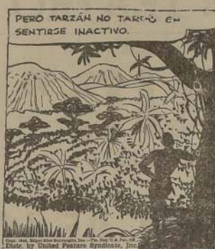
PERO TARZAN NO TARDÓ EN SENTIRSE INACTIVO.