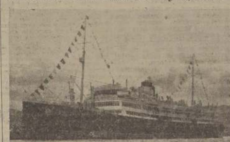
El vapor "Orazio"

MARSELLA, 21. — (U. P.) — El vapor de pasajeros "Orazio" se incendió y quedó totalmente destruido totalmente, un día después de su partida de Génova, en viaje a Valparaíso, llevando a bordo 600 pasajeros y 350 tripulantes, los que prácticamente en su totalidad fueron salvados por dos destructores franceses.