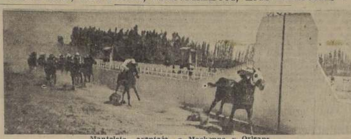
Manteleta aventaja a Mackenna y Orleans

Cubiertos los primeros tramos del derecho, Bella Sombra se entregó ante la ofensiva de Swing, que con