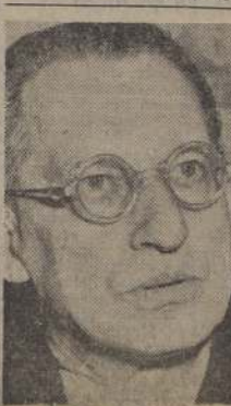
ALCIDO DE GASPERI