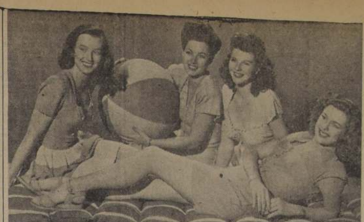
A nadie puede extrañar la popularidad de las prácticas deportivas, si muchachas de los maravillosos atributos de las Goldwyn Girls tienen debilidades por ellas. No hay quien resista la tentación de completar este equipo...