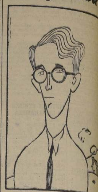
El nuevo Rey de Bélgica, Badoin I, que tras la abdicación de su padre, Leopoldo III, le sucedió.