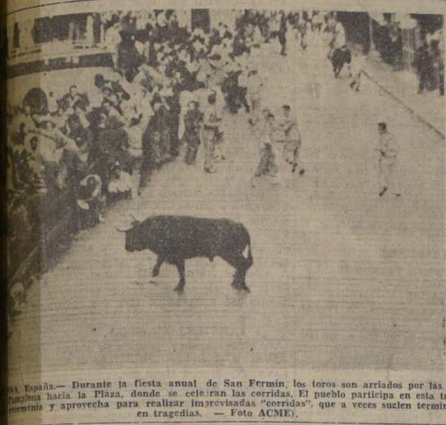
Durante la fiesta anual de San Fermín, los toros son arriados por las ca- balleras hacia la Plaza, donde se celebran las corridas. El pueblo participa en esta tra- dición y aprovecha para realizar improvisadas "corridas", que a veces suelen terminar en tragedias.