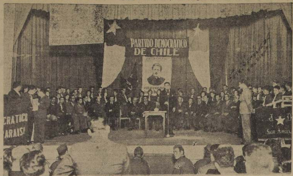
Mesa Directiva del Congreso del Partido Democrático