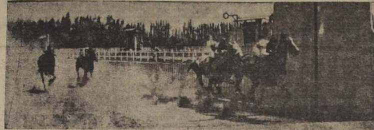
Iticina ganando la sexta del Hipódromo

Una limitada concurrencia asistió a presenciar las carreras matutinas del Hipódromo Chile, cuyo programa desmereció bastante, a última hora, debido a que muchas pruebas quedaron reducidas a cuatro o cinco rivales. La cátedra vio ganar a dos de sus favoritos, que fueron Loricio y Malilme. De los otros, Birmania se clasificó segunda; Mallico y Vodka remataron terceros; Falange fue cuarto y finalmente, Talagantito y Minnepolis no ocuparon sitio en el marcador. Los buenos dividendos no se escasearon y el mejor de ellos estuvo a cargo de Duquesa de York, que repartió $ 133.30 por unidad de cinco, a sus escasos partidarios. Entre los profesionales se distinguió el piloto Ocampo, que se anotó una bonita dobbla dirigiendo a Zara y Carmiña. En la prueba de clausura, que fue ganada por Diamante, se produjo el distanciamiento de este, pasando Kolynos a sustituirlo, fallo que fue bien recibido por el público, pues el hijo de Stockwell molestó en forma visible en la recta al pupilo de Salinas.