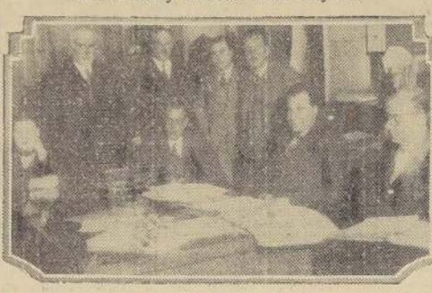
El Ministro señor Serani durante la sesión de ayer de la Junta de la Habitación

Ayuda para la Población Obrera de Magallanes. — La consolidación de las deudas de cooperativistas y afectos a la Ley 33