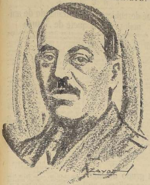
General José Sanjurjo

LA LEY DE AMNISTIA FUE PUBLICADA EN LA MAÑANA CON DOS DECRETOS EXPLICATIVOS.—POCO DESPUÉS DE MEDIODIA RENUNCIABA EL GABINETE.—AL CAER LA NOCHE SALIAN DE SU PRISION EL GENERAL JOSE SANJURJO Y CENTENARES DE REOS POLITICOS MAS.