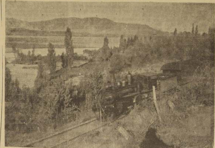
Vista panorámica de los campos de Nipas. Se puede apreciar perfectamente el paso del ferrocarril y la enorme extensión del lecho del río Itata.

CRECES DEL RIO ITATA ARRASAN LOS TERRENOS